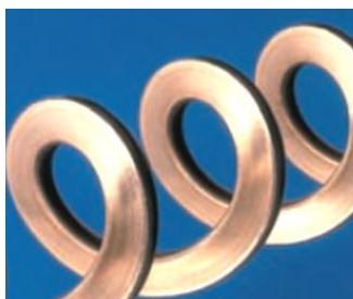
Plattspiral - ger 30% bättre prestanda.