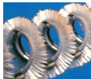
Borstspiral - för mycket vidhäftande material.