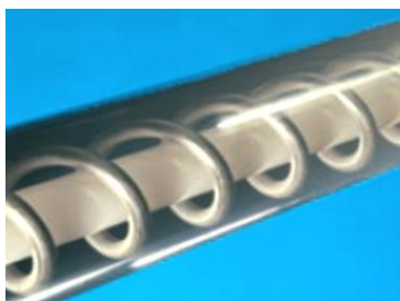
Rundprofilspiral - passar de flesta material.