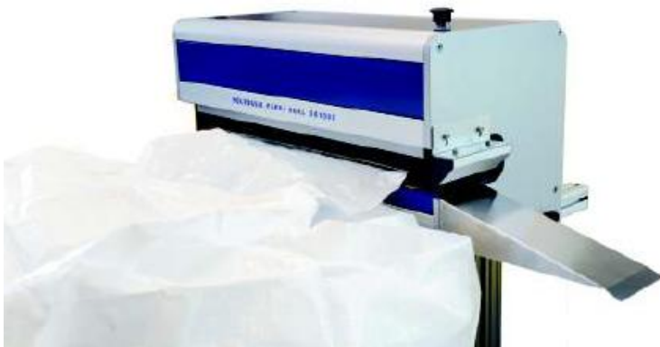
Svets av storsäcksstos. Förslutningsautomat med svetsfunktion. Inkl upphängningsram och med all erforderlig elektronik.