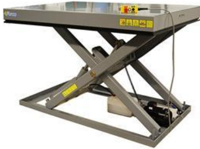
Lyftbord för ergonomisk hämtning av storsäck.