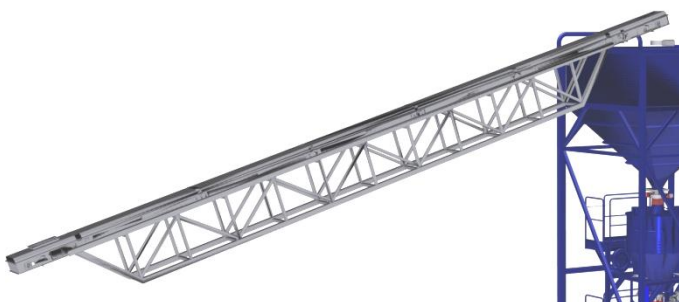
Transportör till buffertbehållare.