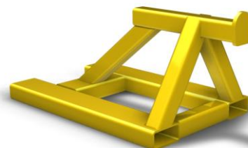
Truckok för hämtning av säck. Finns för 1, 2 eller 3 enöglesäckar samtidigt. För hämtning av mer än en säck krävs sträckning av ögla.