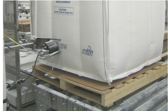
Märkning av storsäck med printern, t ex batchnr, vikt mm.