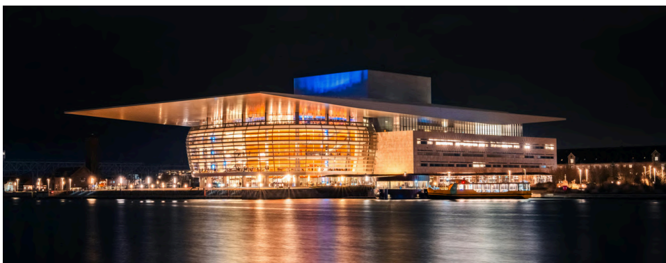
L'opéra de Copenhague

Ce qui dénote le plus dans l'Indre By, c'est que cette touche architecturale centrée sur l'histoire et la tradition rencontre une inspiration ultra moderne, voire avant-gardiste, de certaines constructions récentes. Les scandinaves se sont spécialisés entre autres dans des designs étonnants et détonants. Il y a par exemple l'opéra de Copenhague, que les locaux surnomment affectueusement « le grille-pain », ou bien le BLOX, un centre culturel au design futuriste, qui rappelle une sorte de Rubik's cube géant.