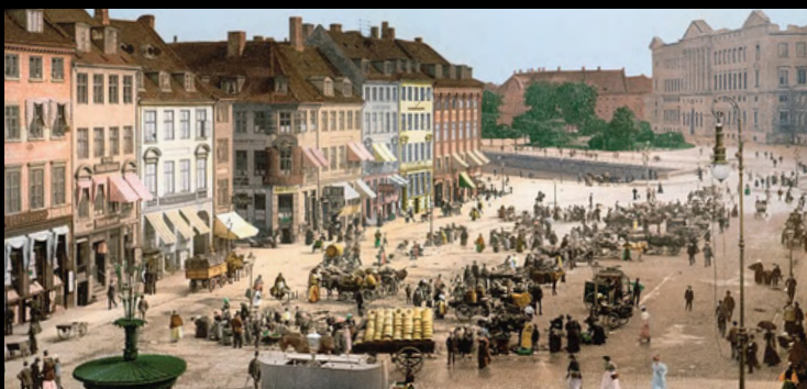
L'Højbro Plads, au cœur de l'Indre By, au début du 20 e siècle

Les nombreuses fortifications autour de l'Indre By ont été démantelées entre 1850 et 1900, ce qui a permis au quartier de s'interconnecter avec d'autres parties de la ville et aux autres quartiers de véritablement graviter autour de son centre historique. L'agrandissement du port et la création de tramways électriques à la fin du 19 e font définitivement passer un cap à l'Indre By et le font entrer de plain-pied dans les quartiers qui comptent en Europe.