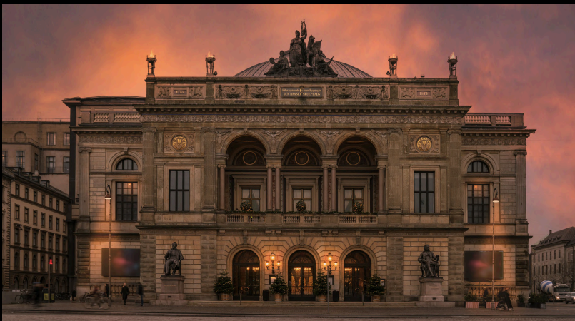
Le théâtre national du Danemark