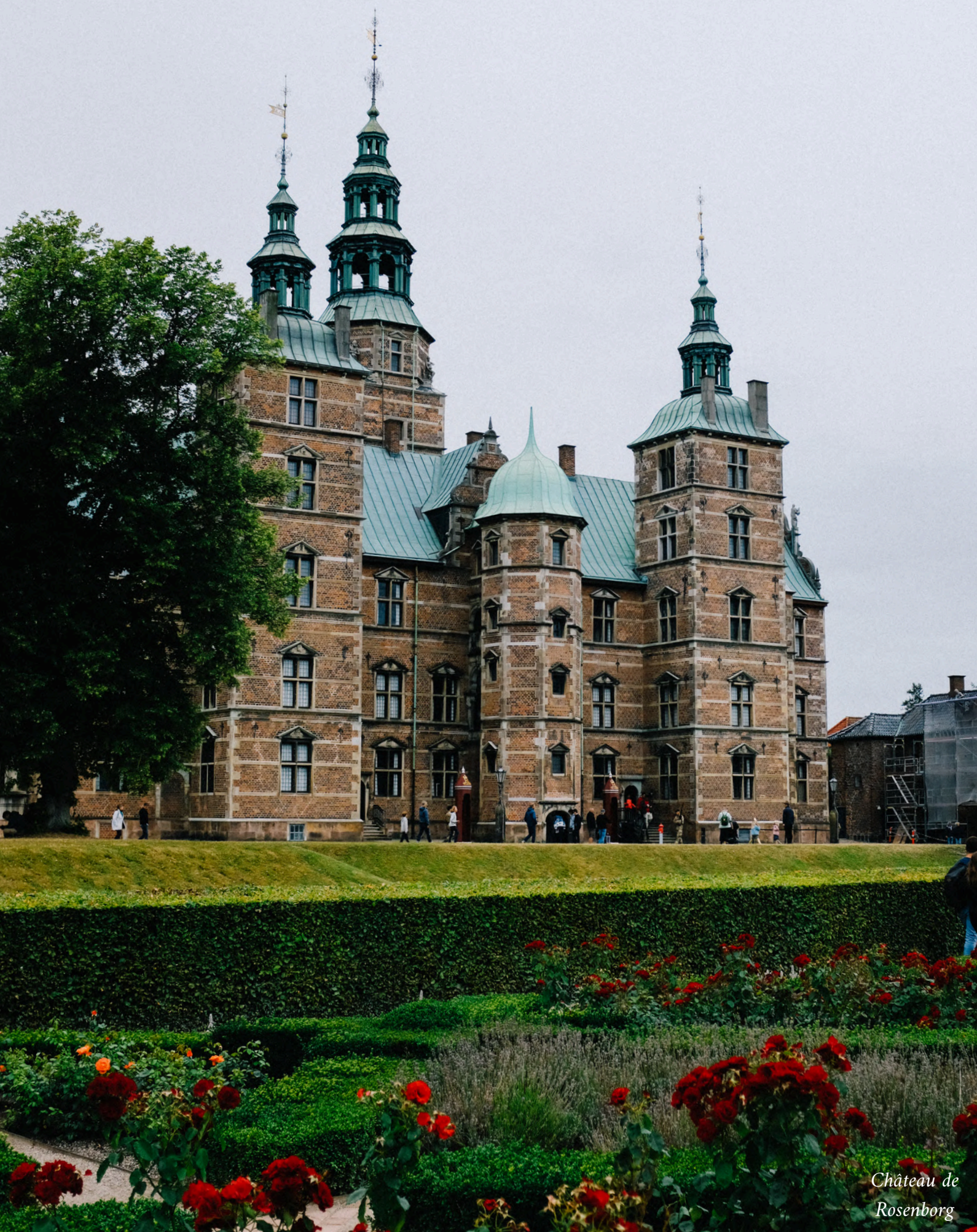
Château de Rosenborg