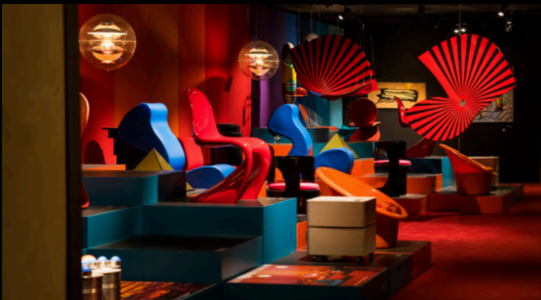
Le musée du design