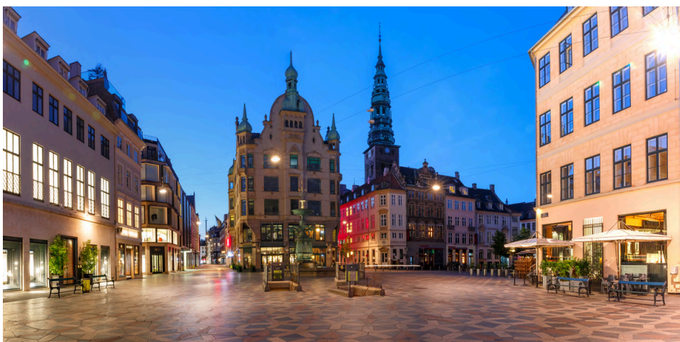
Stroget, la plus grande rue et la plus commerçante de l'Indre By mélange toutes les synergies de l'architecture danoise pour un panorama à couper le souffle.