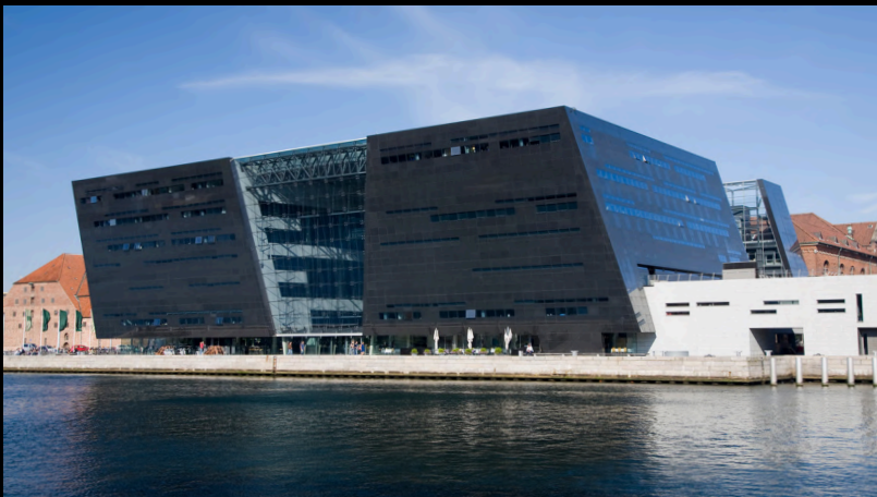
La bibliothèque nationale du Danemark

L'Indre By est un véritable puits de culture et une ode à l'art sous toutes ses formes. Je vous ai déjà parlé du gigantesque BLOX, de l'opéra, mais vous pourrez aussi explorer l'ultra moderne bibliothèque nationale du Danemark, le théâtre national, le musée du design, le musée national qui retrace l'histoire du pays ou encore le SMK, pour Statens Museum for Kunst, un musée d'art pictural qui vous laissera sans voix. Sans bien sûr compter sur toutes les visites de palais, châteaux, églises et de la citadelle.