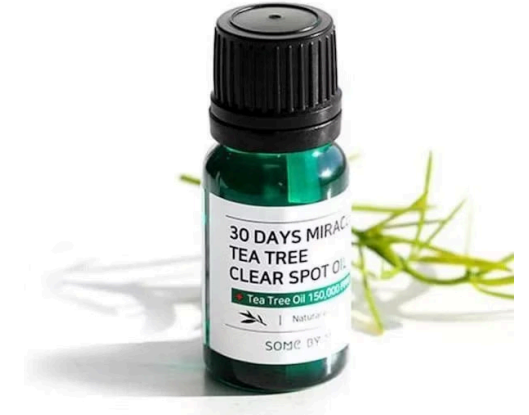
Green Tea Extract