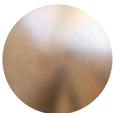
Broušená rose gold lak