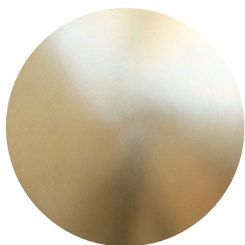
Broušená champagne lak

Naše značka neustále inovuje a rozšiřuje svoje aktivity v oblasti designových inovací, proto jsme se u některých komponentů pro naše kolekce rozhodli vypustit z nabídky použitých materiálů mosaz a měď. BROKIS nyní nabízí čtyři nové povrchové úpravy, které mají za úkol je nahradit. Sada nových laků reaguje na nové trendy ve světě designu a svěže tak reflektuje tyto potřeby.