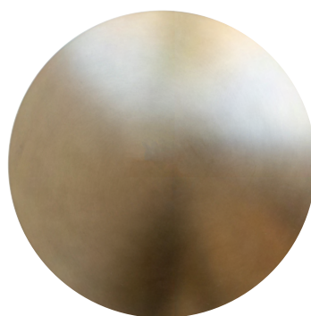
Broušená bronz lak