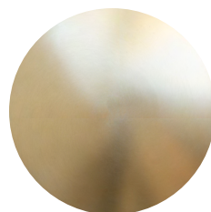
Broušená champagne lak