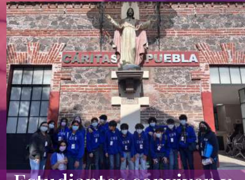
Estudiantes conviven y comparten con los abues