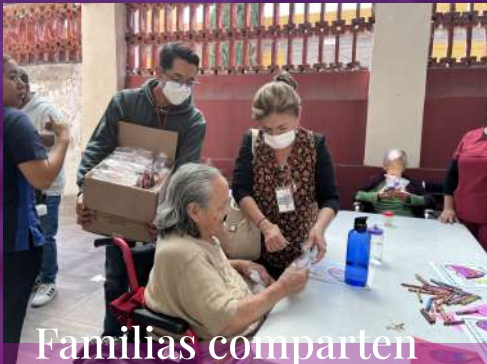
Familias comparten dulces y momentos con los abues

Actividades, comunidad y acompañamiento en Cáritas Puebla