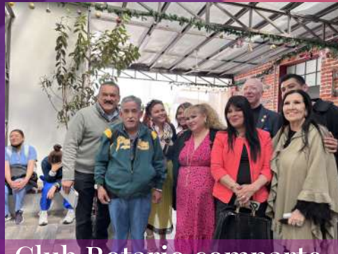
Club Rotario comparte tiempo y solidaridad.