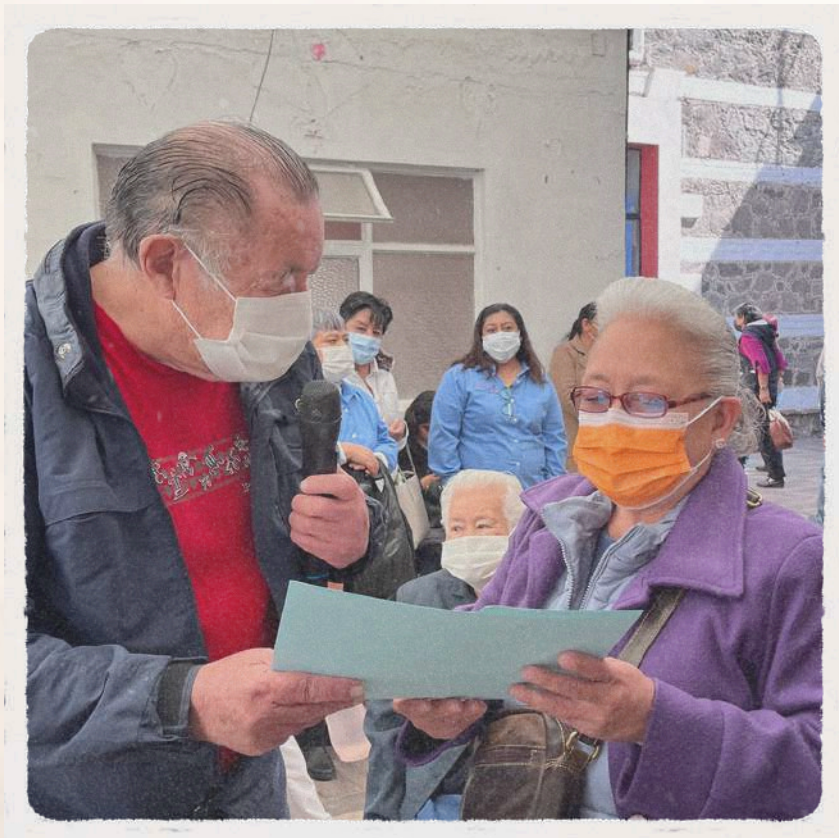
Reconocimiento Cáritas Parroquiales

Durante un año, colocaron alcancías de oración en familias e iglesias, reuniendo apoyo para nuestros abues. Su constancia y compromiso siguen siendo parte esencial de esta misión.