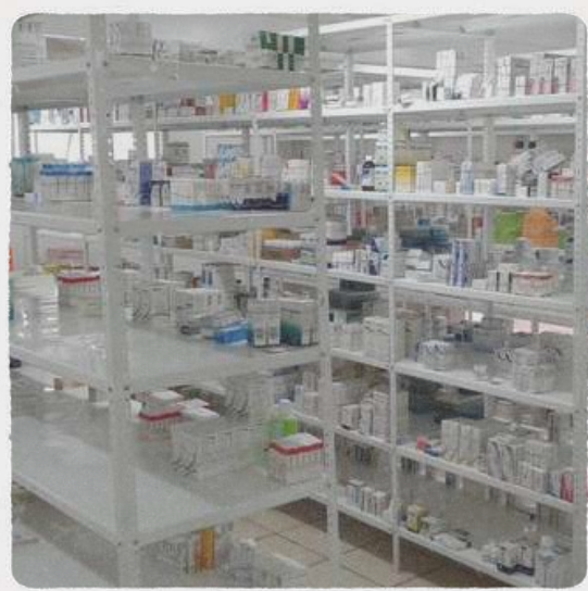
Banco de Medicamentos

Nuestros servicios: Consultas médicas Lunes a sábado 9:00 a 15:00 hrs