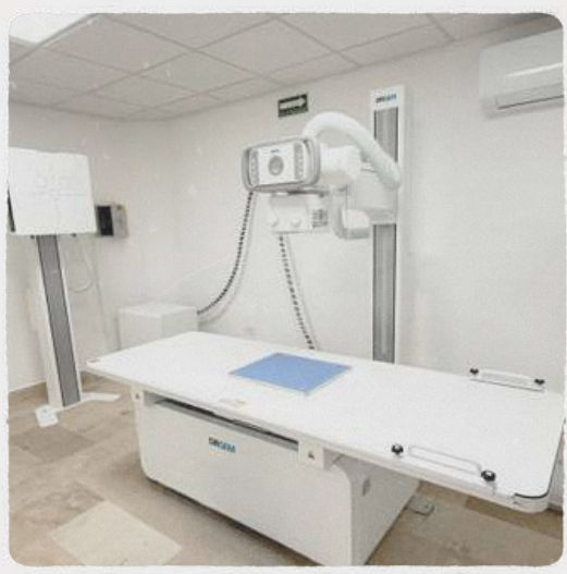
Centro de Diagnóstico