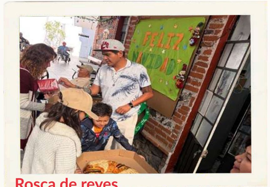
Rosca de reyes

La tradicional partida de rosca reunió a las y los abues, equipo y voluntarios en un momento sencillo, pero lleno de cercanía.