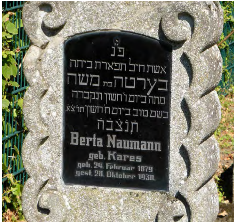
...BERTA בת = BAT = TOCHTER DES MOSCHE