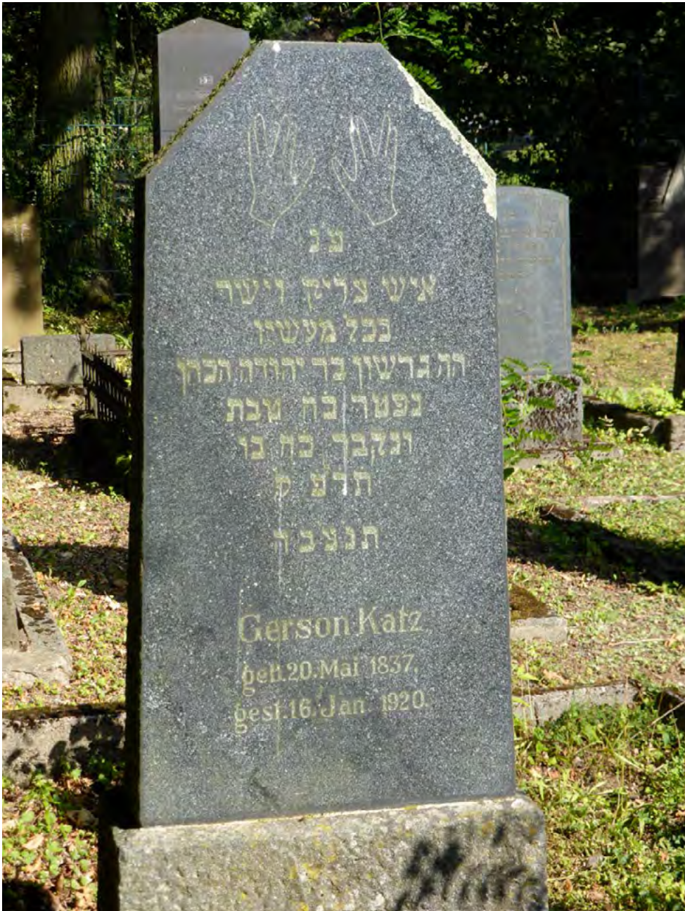
AUS EINEM PRIESTERGESCHLECHT STAMMEND.

Nach dem Namen ist das Sterbedatum das wichtigste Element einer hebräischen Grabinschrift. Die Daten in hebräischer Grabinschrift werden immer nach dem jüdischen Kalender angegeben. Wenn es heißt E. W. verstarb am 22. Tewet 5670, ist das der 3. Januar 1910.