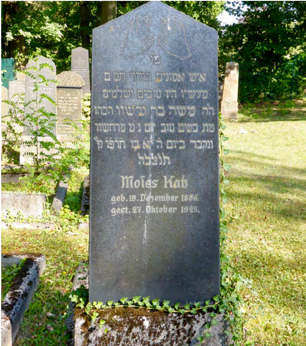
DIE HALTUNG DER HÄNDE DES PRIESTERS BEIM ERTEILEN DES SEGENS.

Die Einleitungsformel auf dem Grabstein heißt meisten: פ נ „Hier ist begraben“ oder „Hier ist geborgen“.