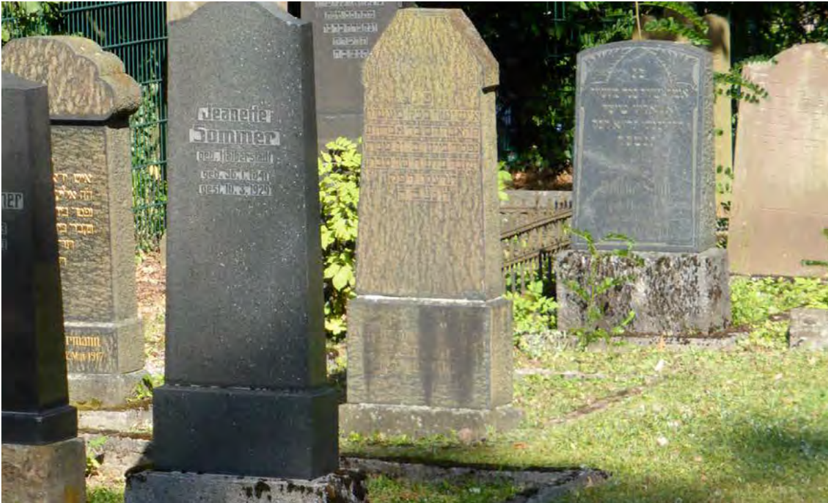
GRABSTEINE AUF DEM JÜDISCHEN FRIEDHOF NIDDA

Ein Buch, oft aufgeschlagen, steht für die Gelehrsamkeit und die religiöse Bildung. Dieses findet sich meist auf dem Grabstein von Vorbetern und Rabbinern.