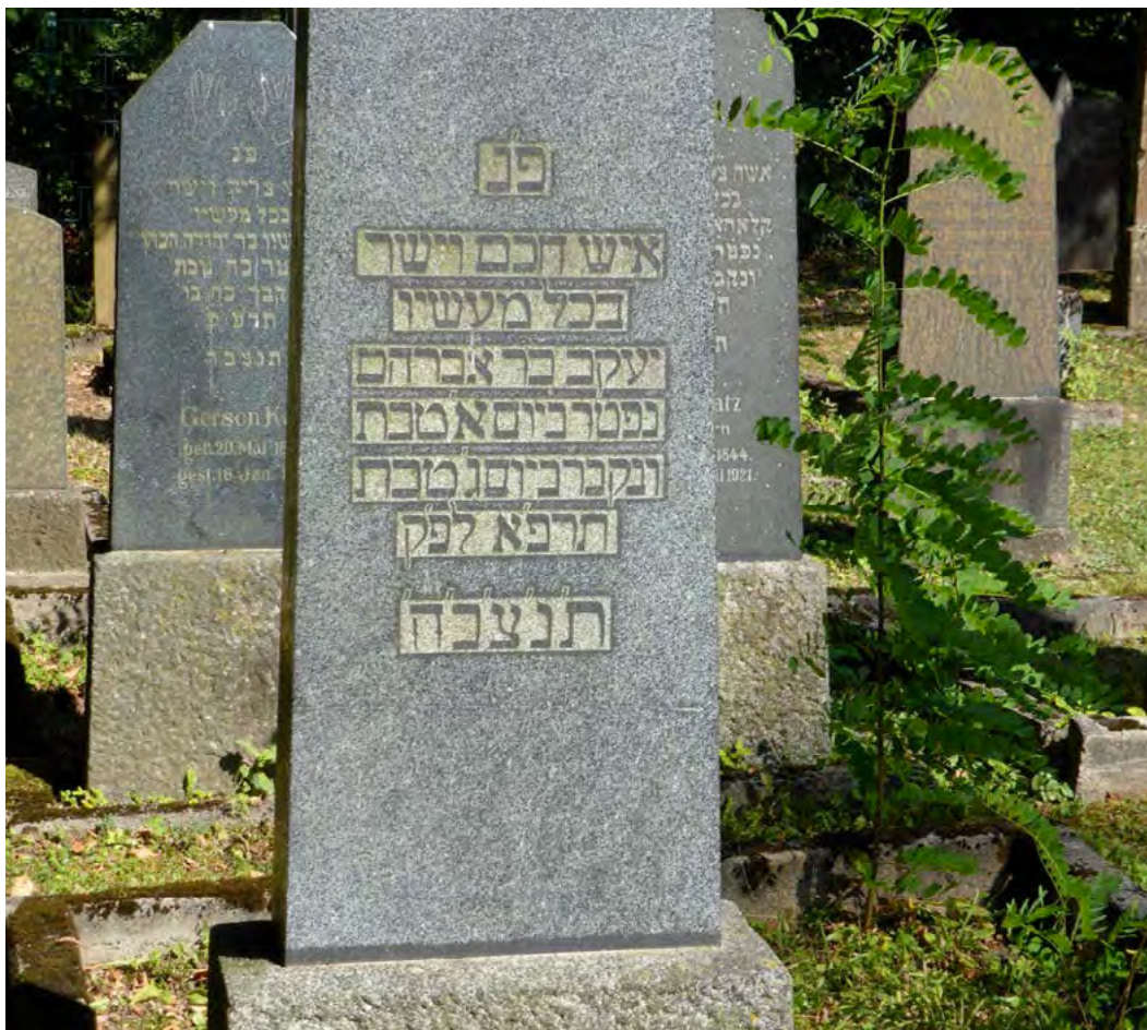
BEISPIEL EINES GRABSTEINS NUR IN HEBRÄISCH

Es gibt auch sogenannte Amtssymbole, zum Beispiel bei einem Mohel, einem Beschneider, wird ein Messer abgebildet oder bei einem Bläser des Schofars, das Abbild eines Schofarhorns.