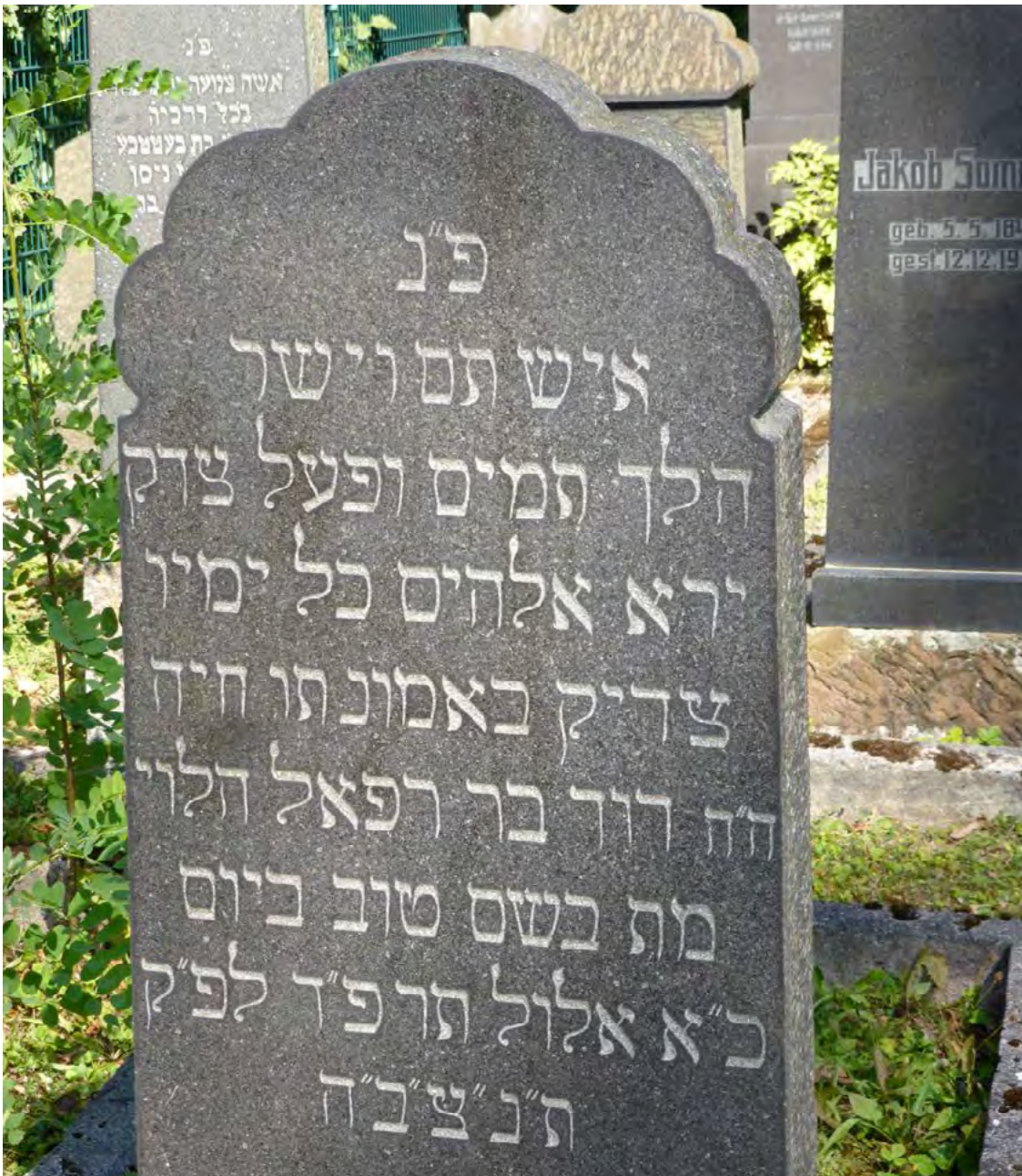
BEISPIEL EINES GRABSTEINS GANZ IN HEBRÄISCH: ...DAVID בר BAR = SOHN DES RAFAEL...

Der Name wird meist eingeleitet durch die Angabe des Status des oder der Verstorbenen: zum Beispiel das Kind, der Knabe, das Mädchen, Mutter = אם , die Jungfrau, der Bräutigam, Mann = איש oder Ehefrau = אשת oder Witwe. Diese Begriffe geben einen Anhaltspunkt für den Lebenschnitt, in dem sich der oder die Verstorbene befand.