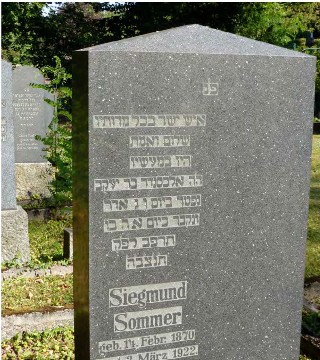
BEISPIEL EINES GRABSTEINS : ALEXANDER בר = BAR = SOHN JAKOBS

Das wichtigste Element, das in jeder Grabinschrift genannt ist, ist der Name des Verstorbenen. Der Name eines Mannes setzt sich zusammen aus seinem Vornamen und dem Namen seines Vaters, zum Beispiel Abraham Sohn = בר des Mose. Der Name einer Frau = אשת setzt sich zusammen aus ihrem Vornamen und den Namen ihres Vaters, zum Beispiel Sara, Tochter = בת des Mose, bei verheirateten Frauen in der Neuzeit auch ergänzt und ersetzt durch den Namen des Gatten: Sara, Tochter des Mose, Gattin des Abraham.