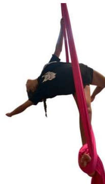
FD_002 APPOGGIO DI SCHIENA FLESSO