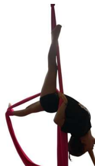
FD_004 GAZZELLA SPLIT