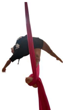
FD_001 APPOGGIO DI SCHIENA STESO