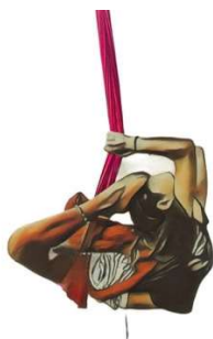
FD_003 SCORPIONE BEND