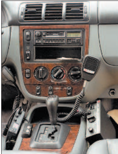
La camioneta Mercedes Benz está equipada con un radio comunicador además de tener una sirena.

En las últimas semanas, personas originarias de Sinaloa se han visto involucradas en ejecuciones, ya sea como víctimas o victimarios.