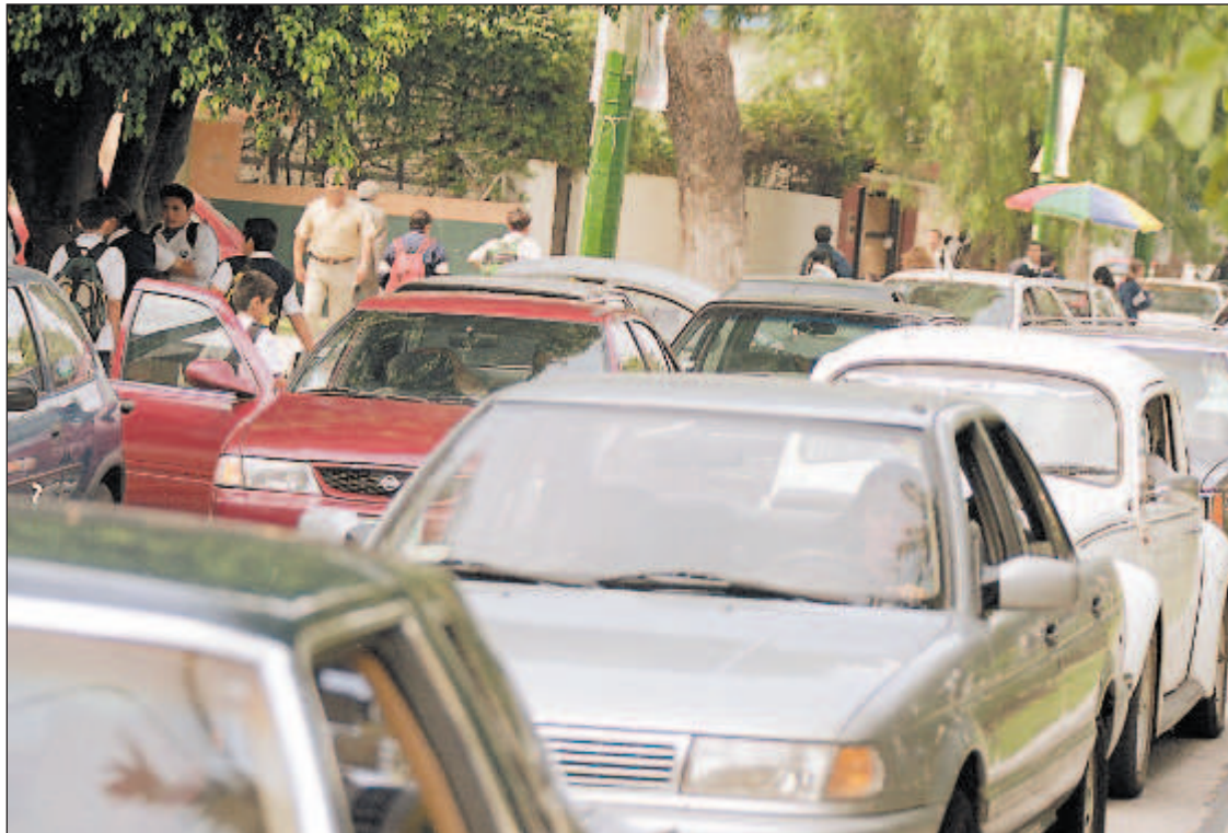
Alrededor de las 13:00 horas la circulación por Las Rosas es a vuelta de rueda, ya que los padres de familia que van a recoger a sus hijos se detienen en doble fila.