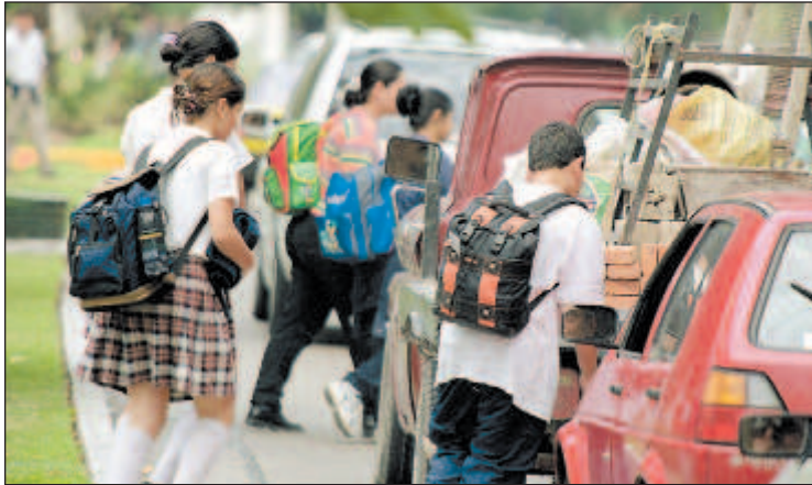
Los estudiantes de las nueve escuelas que se encuentran en la avenida tiene la misma hora de entrada y salida.

La fiesta comienza a las 13:00 horas, cuando los estudiantes se empiezan a ver cruzar la calle, media hora