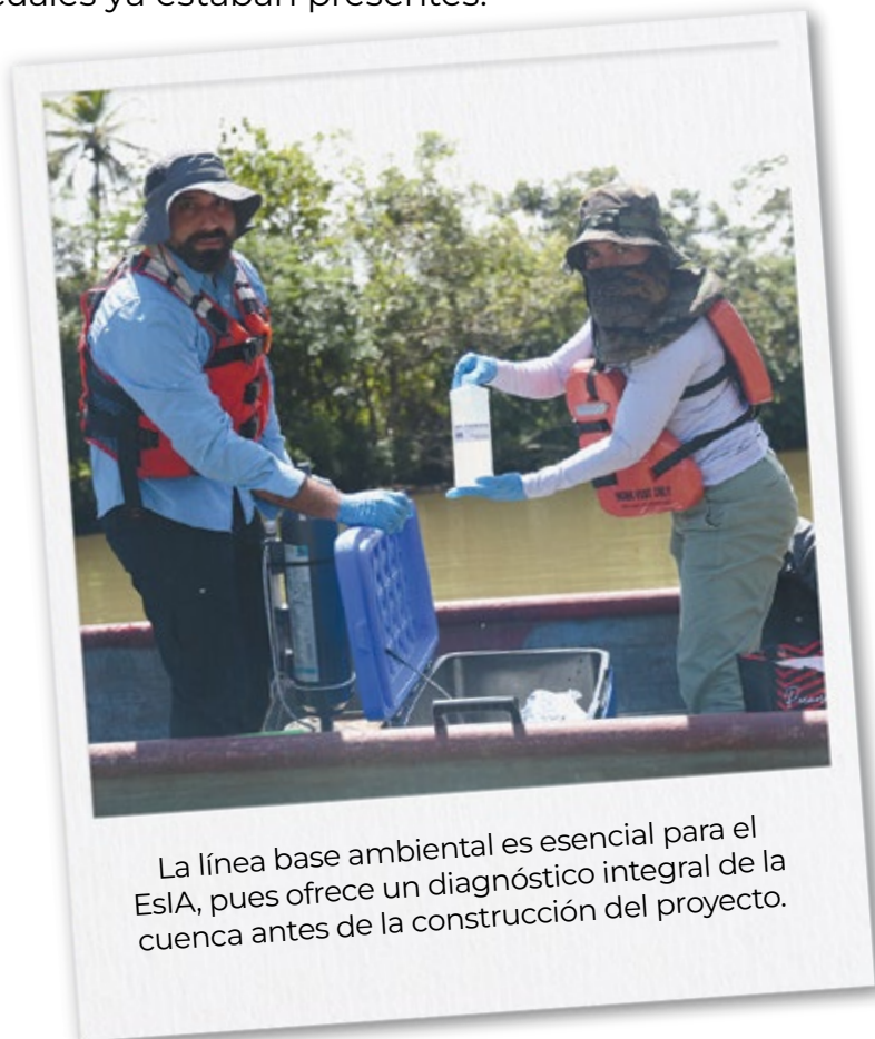
La línea base ambiental es esencial para el EslA, pues ofrece un diagnóstico integral de la cuenca antes de la construcción del proyecto.

Así, el proyecto no se evalúa de forma aislada, sino en relación con la realidad ambiental y social existente.