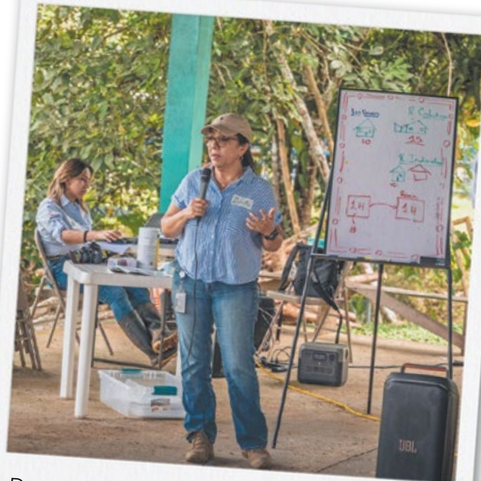
Durante las reuniones con las familias, el Canal de Panamá presentó el contenido del marco de compensación en documentos por escrito.

Con el Marco de Compensación como base, el proceso avanza hacia una etapa más personalizada, en la que cada familia será atendida de manera individual. En esta fase: