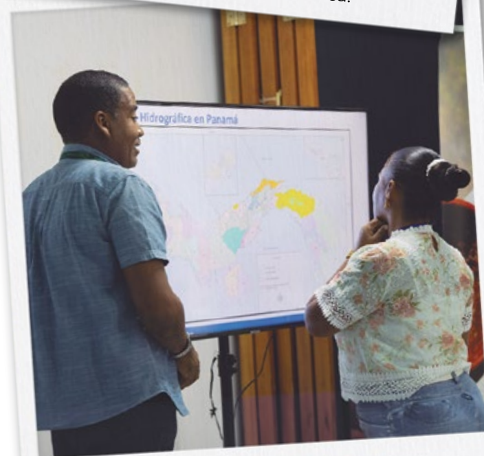
Durante las jornadas de capacitación con el Canal, técnicos de las instituciones fortalecen sus conocimientos sobre la conservación de las fuentes de agua como el río Indio.