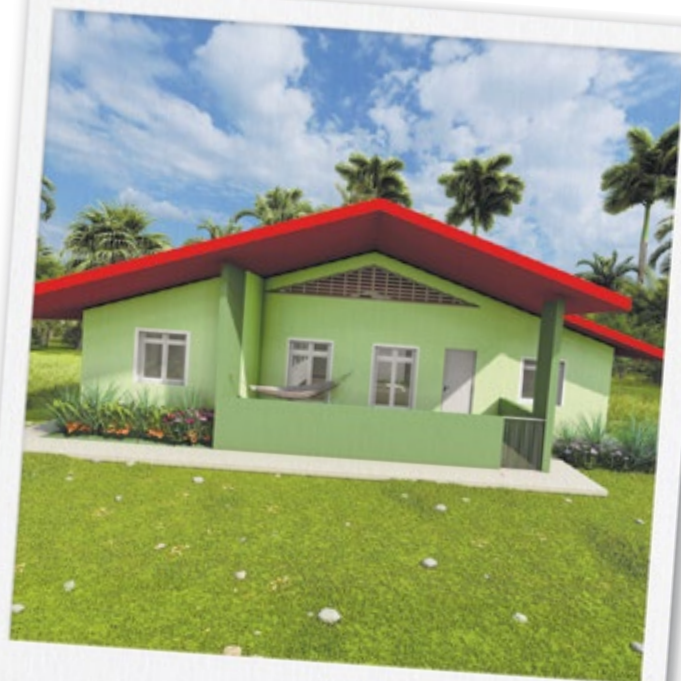
El marco de compensación incluye los aportes de las comunidades y las familias en temas como diseño de las viviendas, entre otros.

Cada acuerdo será diferente, porque responde a realidades distintas. Por eso, este proceso se desarrollará de forma progresiva, con acompañamiento cercano y el tiempo necesario para que cada familia pueda conocer, evaluar y tomar decisiones con claridad.