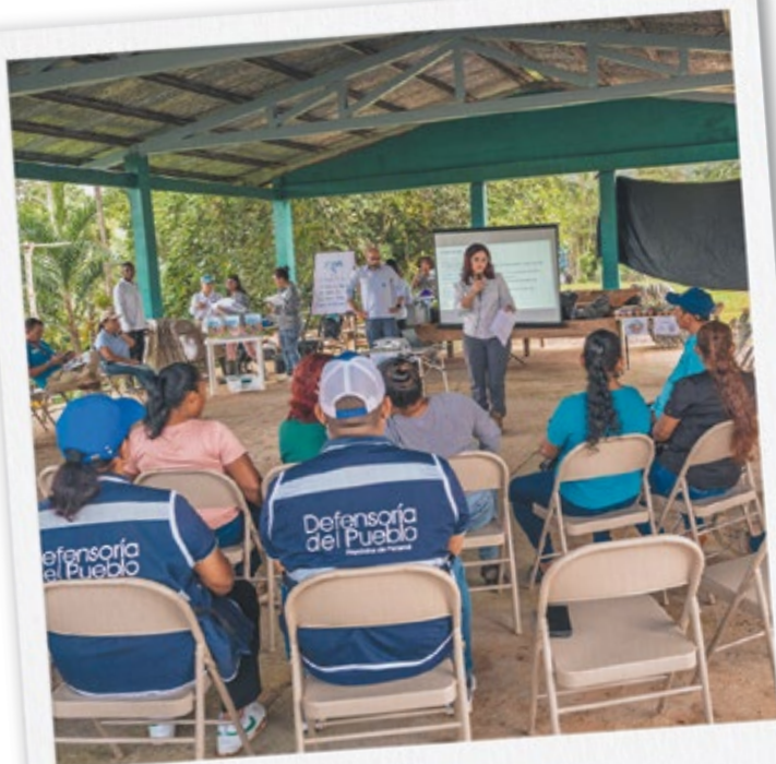
La elaboración del Plan de Acción de Reasentamiento (PAR) es un proceso que inició en mayo de 2025 junto a las comunidades y las familias.