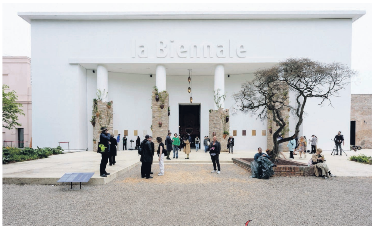
Installatie van Otobong Nkanga, bij de entree van het tentoonstellingspaviljoen van de Biennale.

Door Anna van Leeuwen Illustraties Melanie Corre