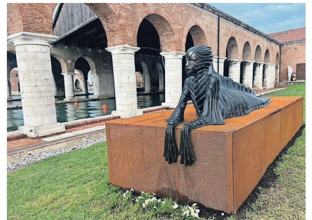
SimbiSiren van Wangechi Mutu.

sculpturen niet zouden misstaan in een hotellobby in South Beach (Florida).