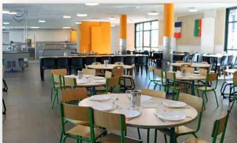
Restaurant bâtiment Frère Marc 20 rue Feuillat

Le repas prend la forme d'un restaurant service à table pour les maternelles, « mode self » pour l'ensemble des autres élèves .