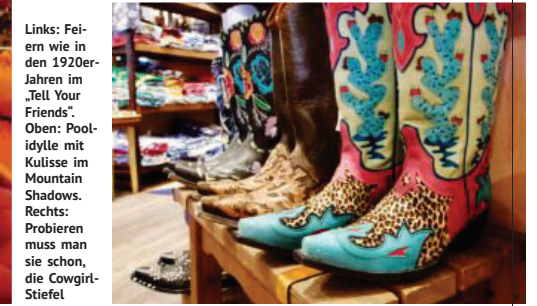
Links: Feiern wie in den 1920er-Jahren im „Tell Your Friends“. Oben: Pool-idylle mit Kulisse im Mountain Shadows. Rechts: Probieren muss man sie schon, die Cowgirl-Stiefel