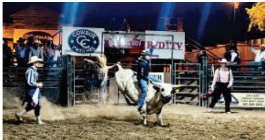
Adrenalin pur im Buffalo-Chip-Saloon: Dieser Bullenreiter hielt sich drei Sekunden