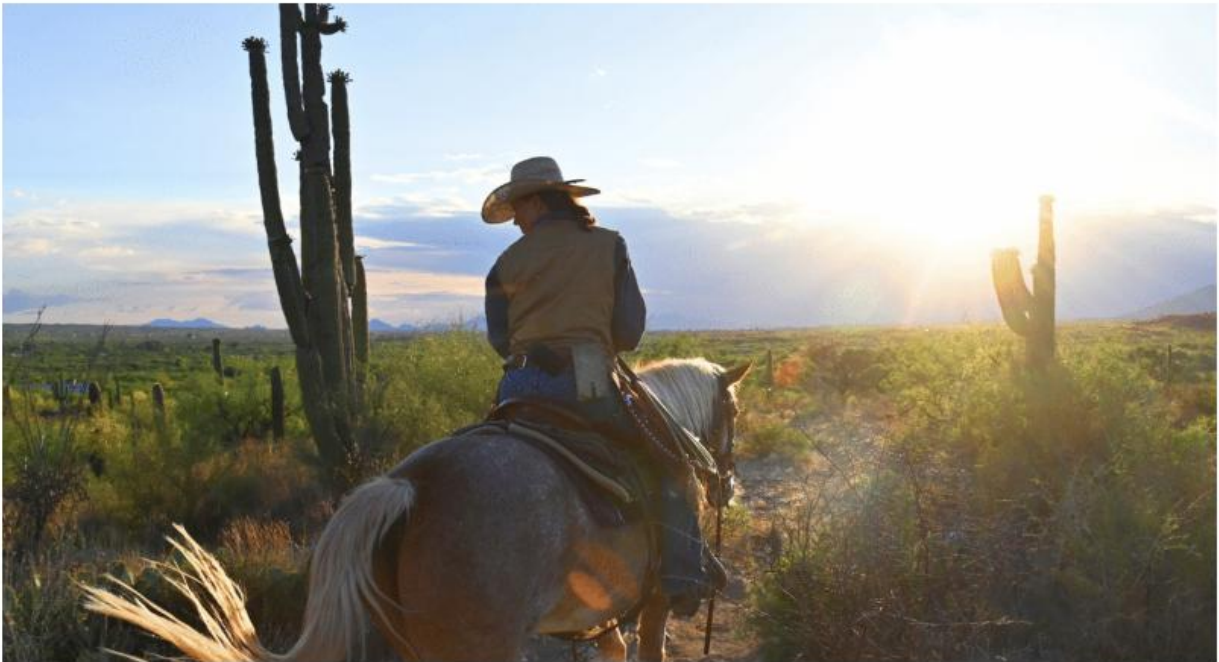
White Stallion Ranch