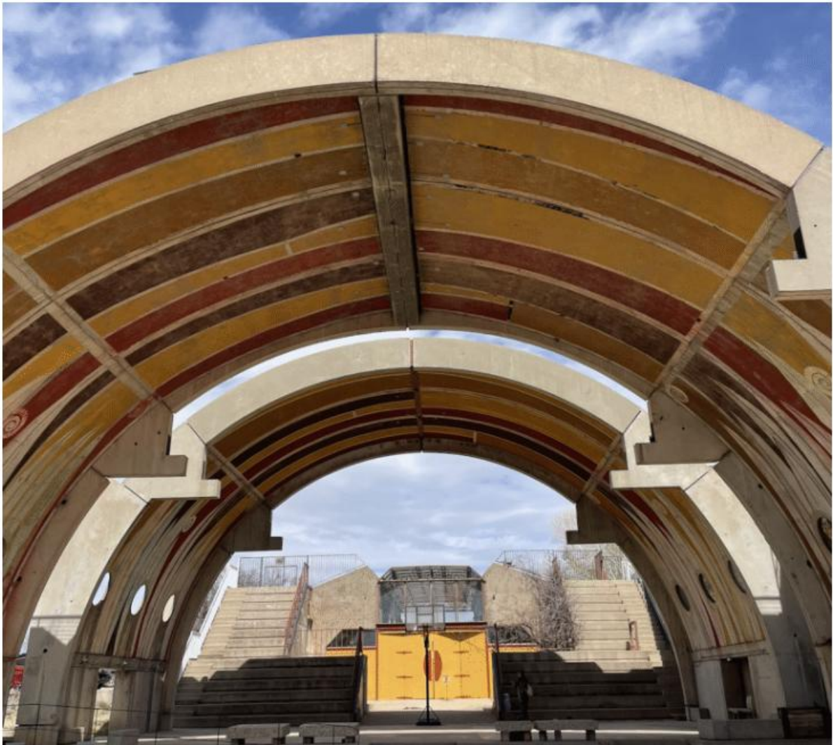
Arcosanti Arizona