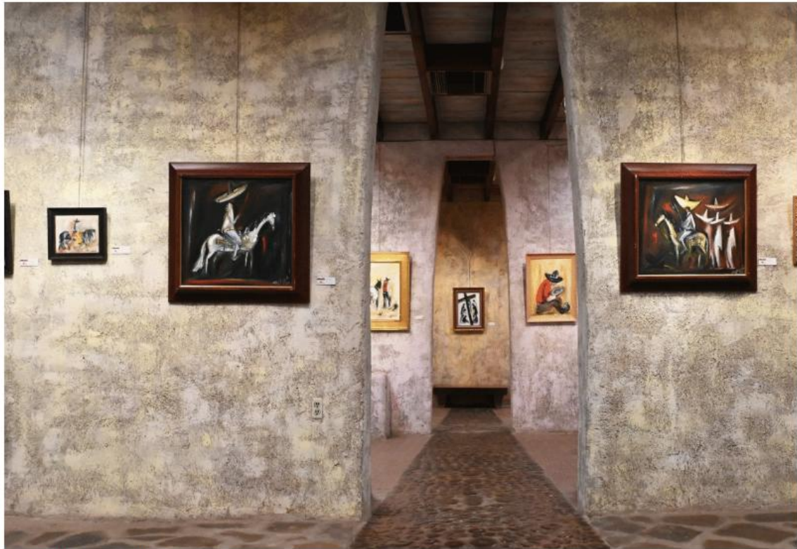
Galerie DeGrazia @antoinelorgnier