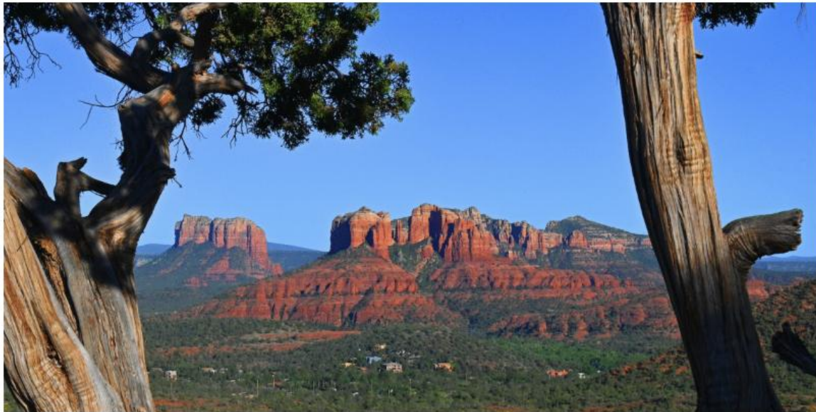
Sedona roches rouges