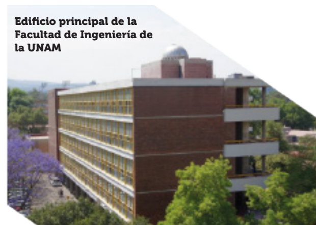
Edificio principal de la Facultad de Ingeniería de la UNAM

Un campo en constante evolución con nuevas herramientas y técnicas. ¿Qué más revelará sobre la inteligencia artificial y el futuro del mundo?