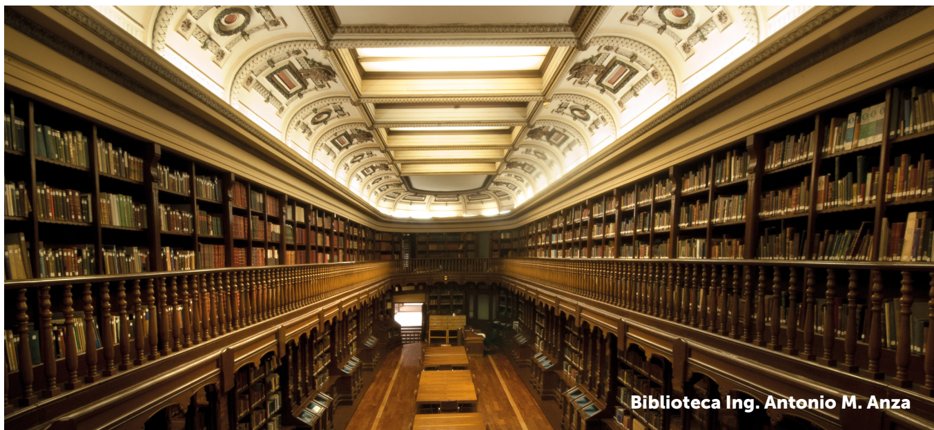
Biblioteca Ing. Antonio M. Anza

¡Desafía los límites y lleva tu carrera al próximo nivel!