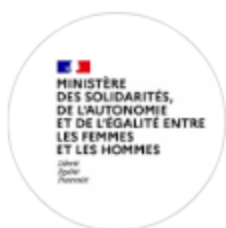
Figure dans le plan anti chute du Ministère chargé de l'autonomie .

orikio sélectionné par le Ministère de l'Economie pour présenter sa solution lors d'un événement lié aux Jeux Paralympiques .