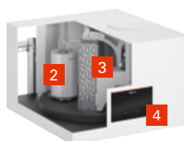
Vitocal 262-A Type T2W-R290

Variante hybride avec échangeur de chaleur pour utilisation conjointe avec des générateurs à énergie fossile