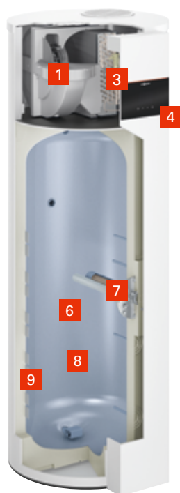
Vitocal 262-A Type T2E-R290

Variante électrique avec système chauffant électrique en remplacement d'un ballon électrique ou le fonctionnement conjoint avec une pompe à chaleur dédiée au chauffage