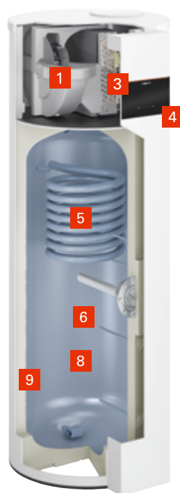
Vitocal 262-A Type T2H-R290

Variante électrique avec système chauffant électrique en remplacement d'un ballon électrique ou le fonctionnement conjoint avec une pompe à chaleur dédiée au chauffage