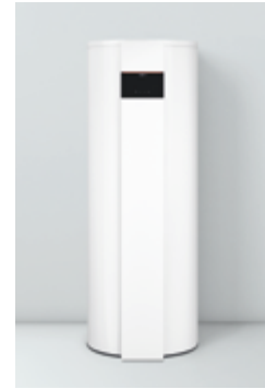
Vitocal 262-A Types T2E-R290/T2H-R290

*** Essais avec Vitocell 100-V (type CVAA), capacité de 300 litres