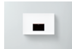
Vitocal 262-A montage au mur Type T2W-R290