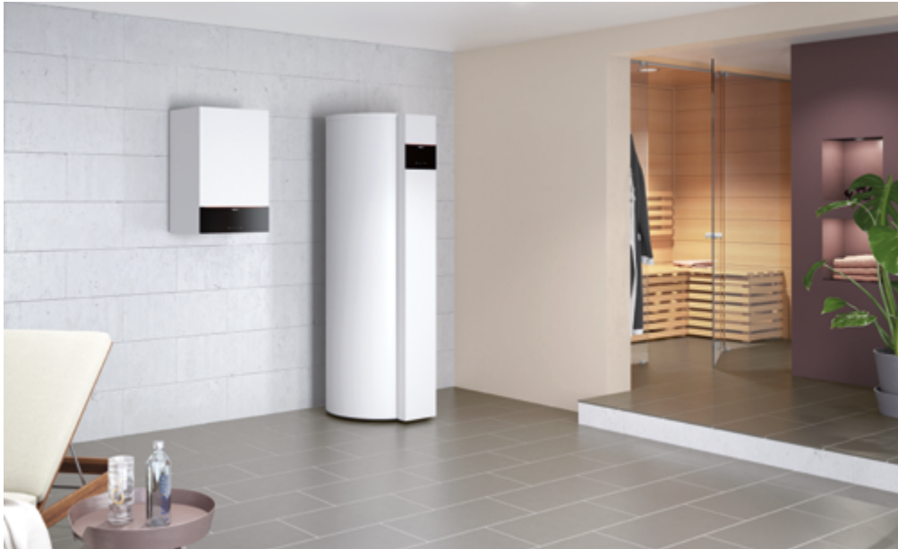
Ballon thermodynamique Vitocal 262-A en combinaison avec une chaudière murale gaz à condensation Vitodens 200-W

Le ballon thermodynamique Vitocal 262-A fournit de l'eau chaude sanitaire à partir de l'air ambiant ou de l'air extérieur : économique et écologique.