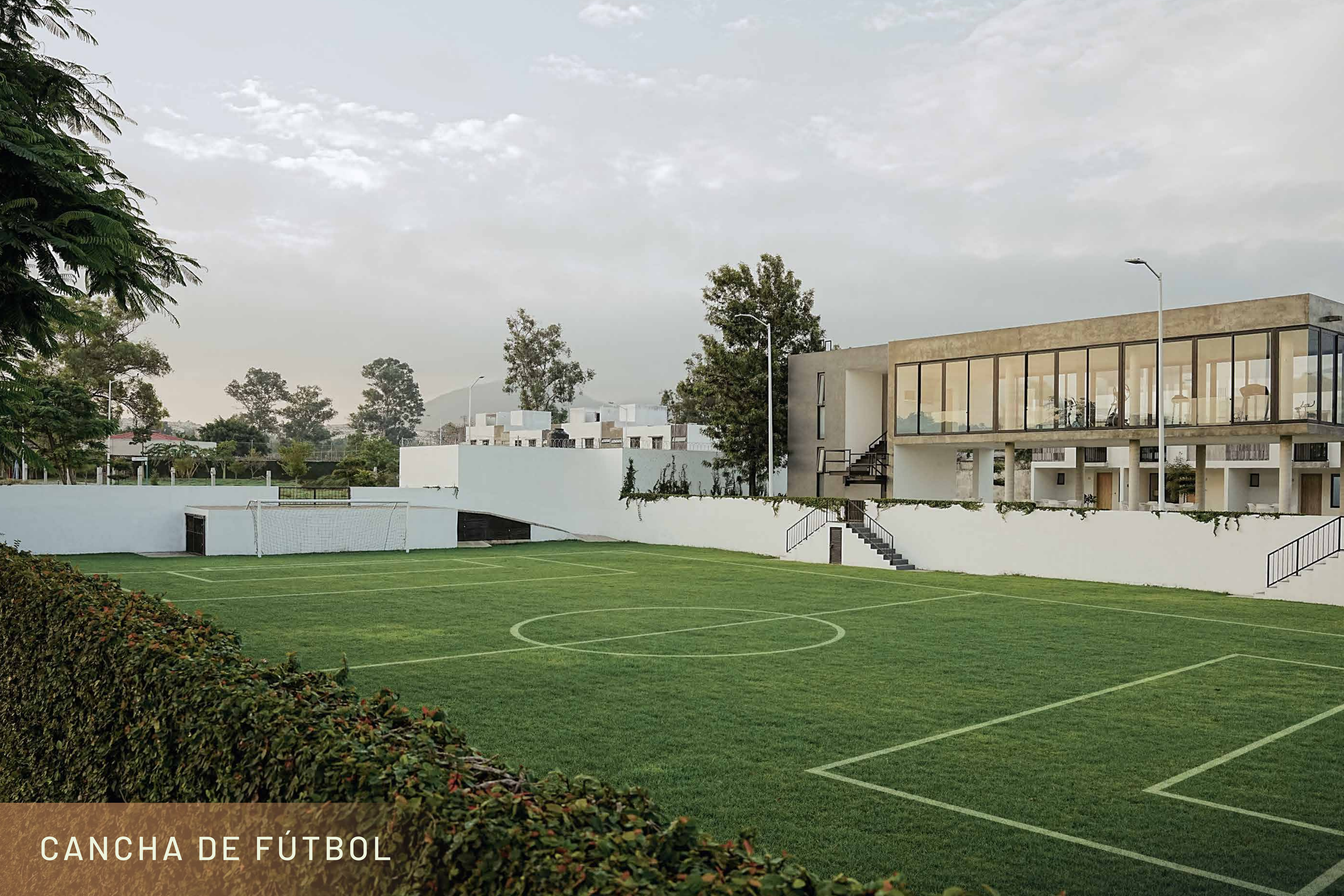
CANCHA DE FÚTBOL