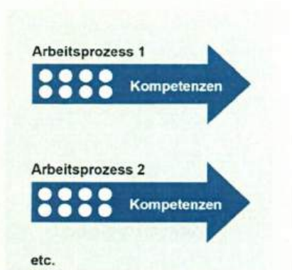
Abbildung 2: Aufbau des Berufsprofils