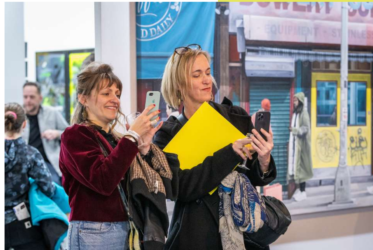
Urban Art Fair