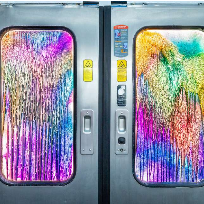
Maxime Drouet