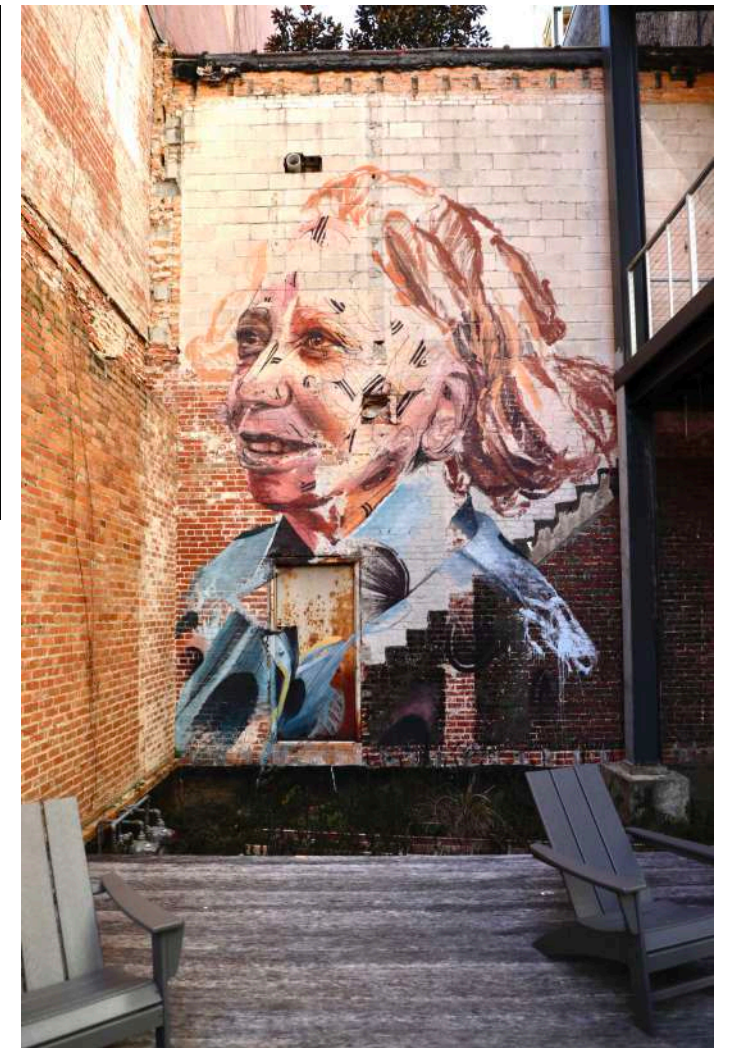
Hopare, Montgomery Art Project