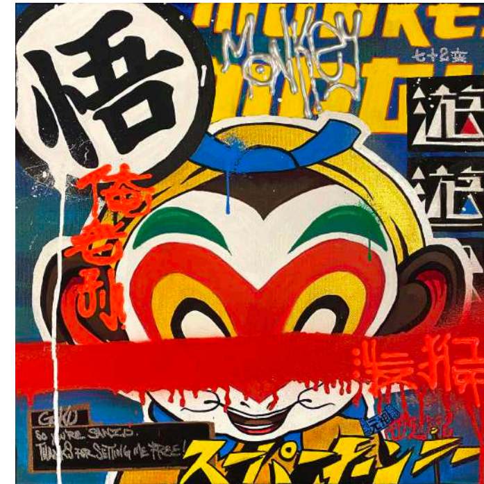
ANTZ, The Block A Collective