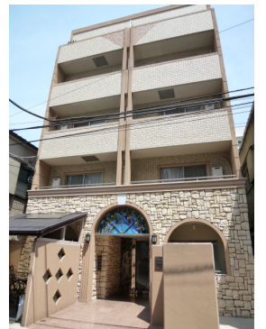
プチグランデピア 外観

※図面と現況が異なる場合は現況を優先とします。 ※写真の製品とは異なる場合があります。 ※インターネット・有料チャンネルのご利用には、別途各会社との契約が必要です。 ※個人契約の際は家賃保証会社のご契約が必要となります。