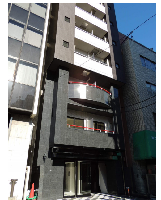
プチグランデ秋葉原外観