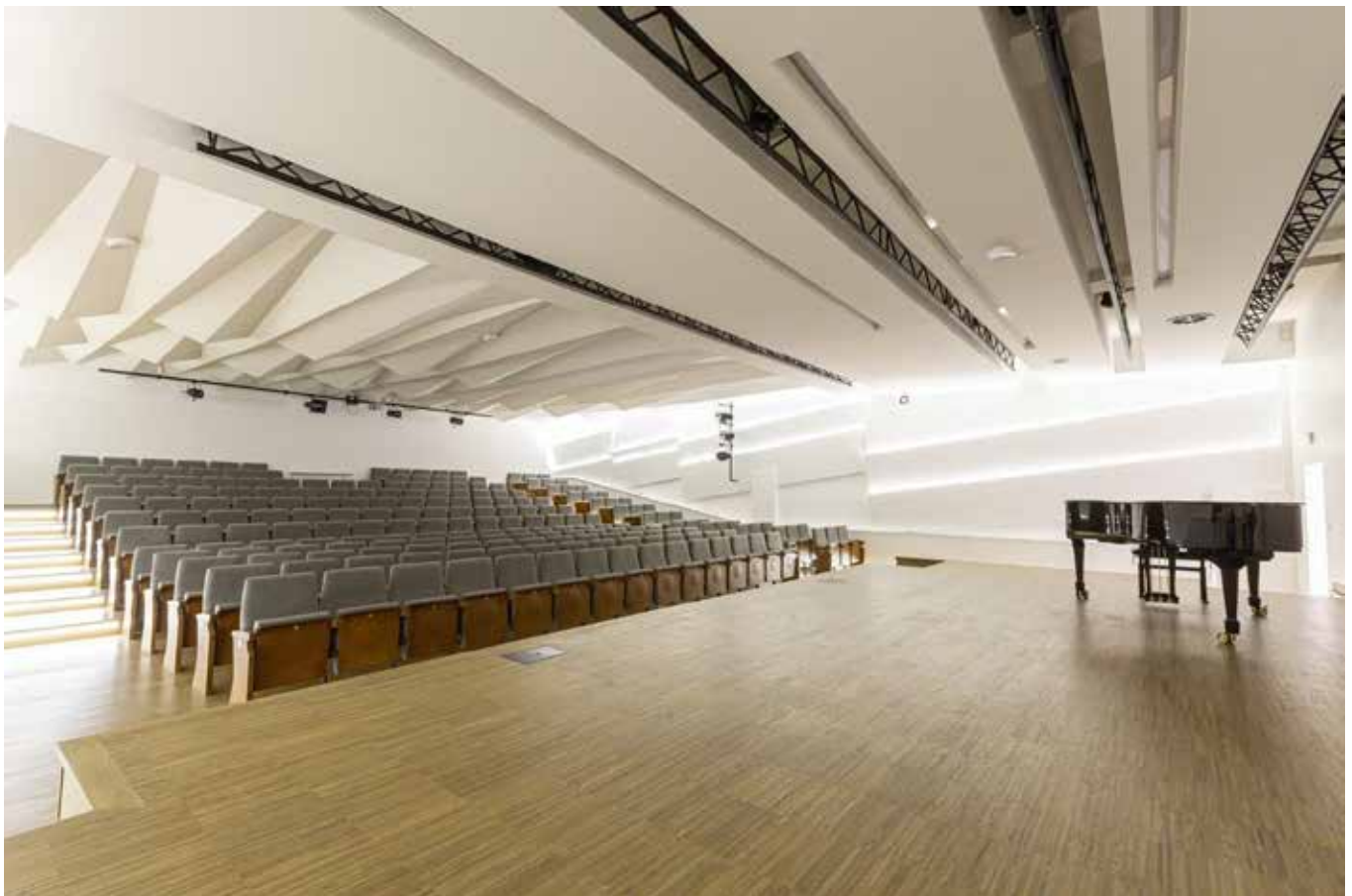
AUDITORIO PAŃSTWOWA SZKOŁA MUZYCZNA STRYZOW| POLONIA