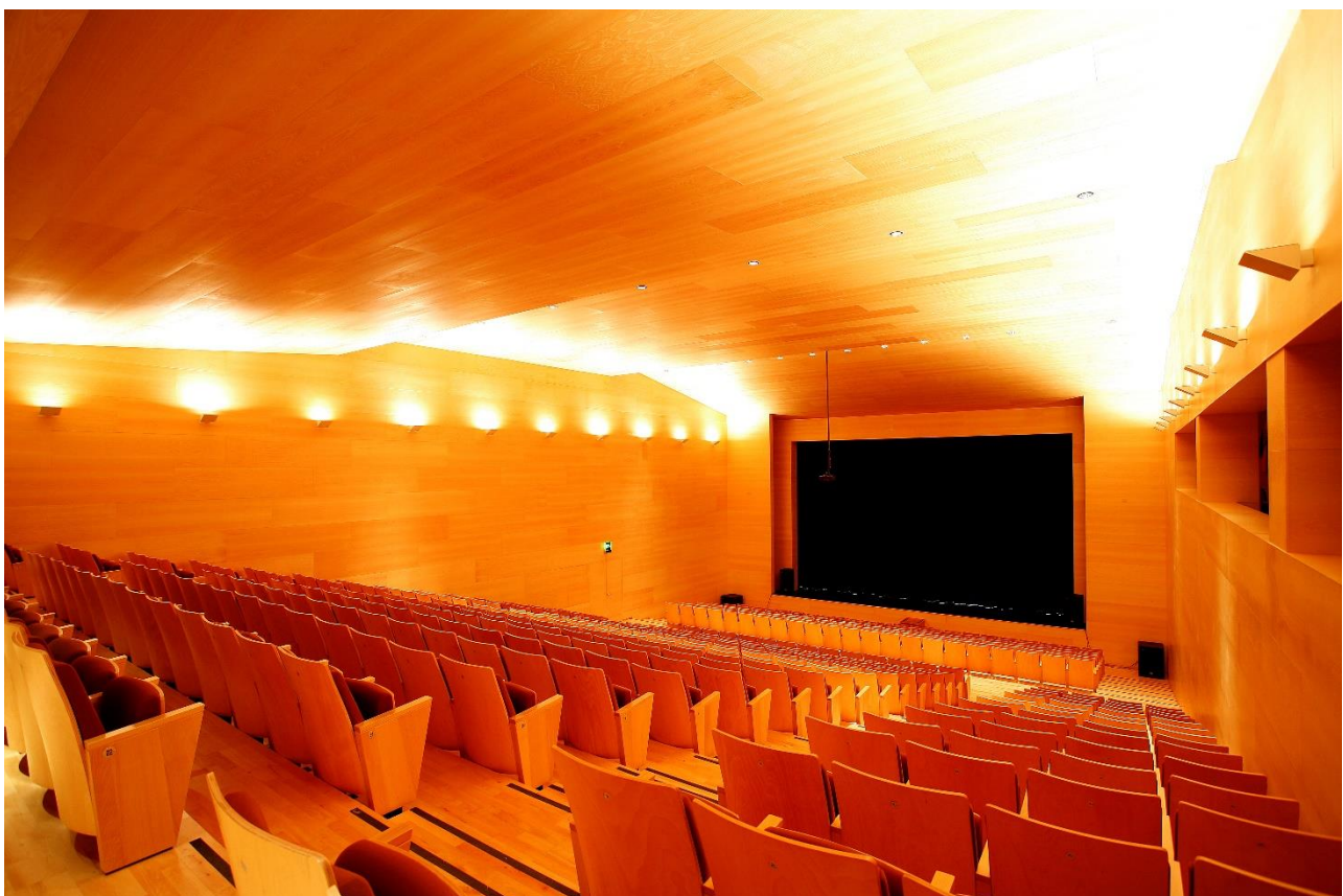
TEATRO AUDITORIO ALCALDE FELIPE BENITEZ ROTA | CADIZ | ESPAÑA