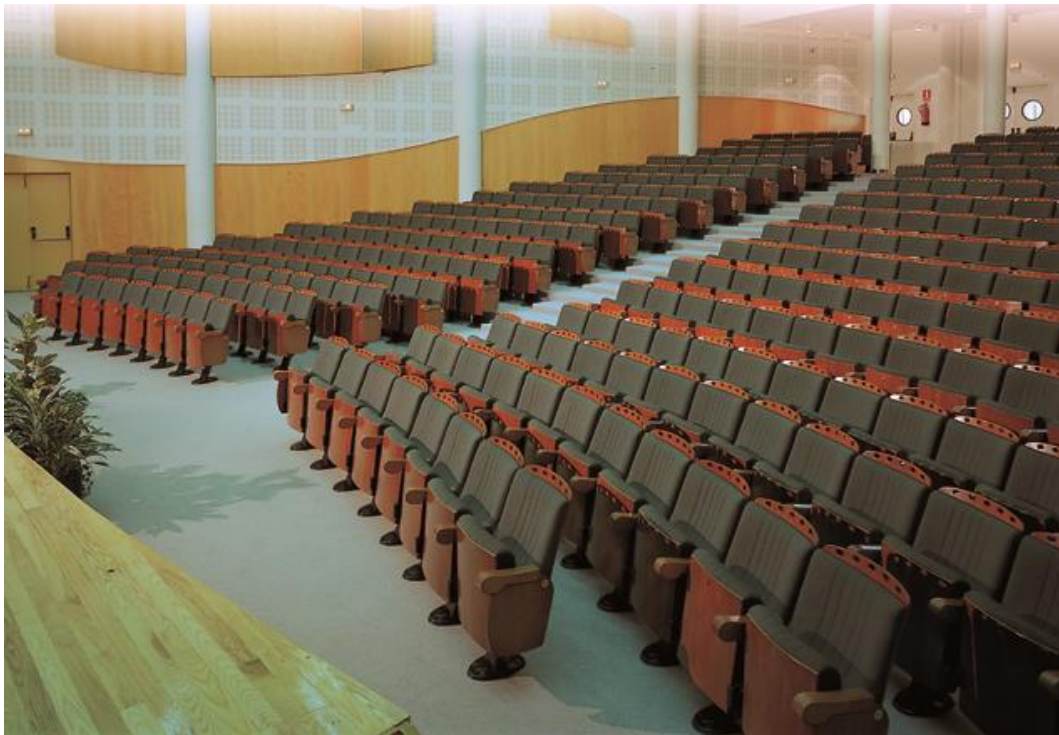
AUDITORIO CONSERVATORIO DE JESÚS DE MONASTERIO SANTANDER | CANTABRIA | ESPAÑA