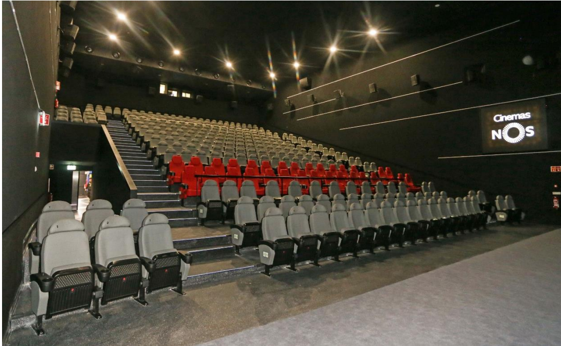
CINEMAS NOS OEIRAS PARQUE PAÇO DE ARCOS | PORTUGAL