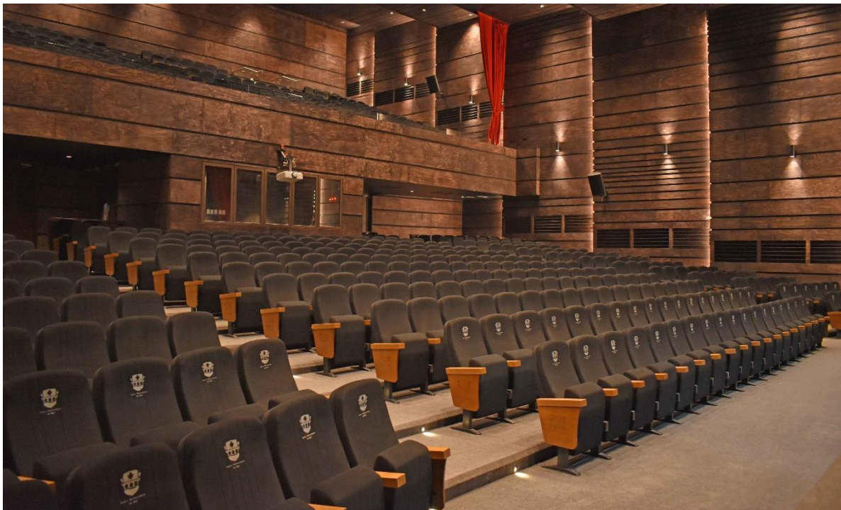
TEATRO CENTRO CULTURAL DE BUIN BUIN | CHILE