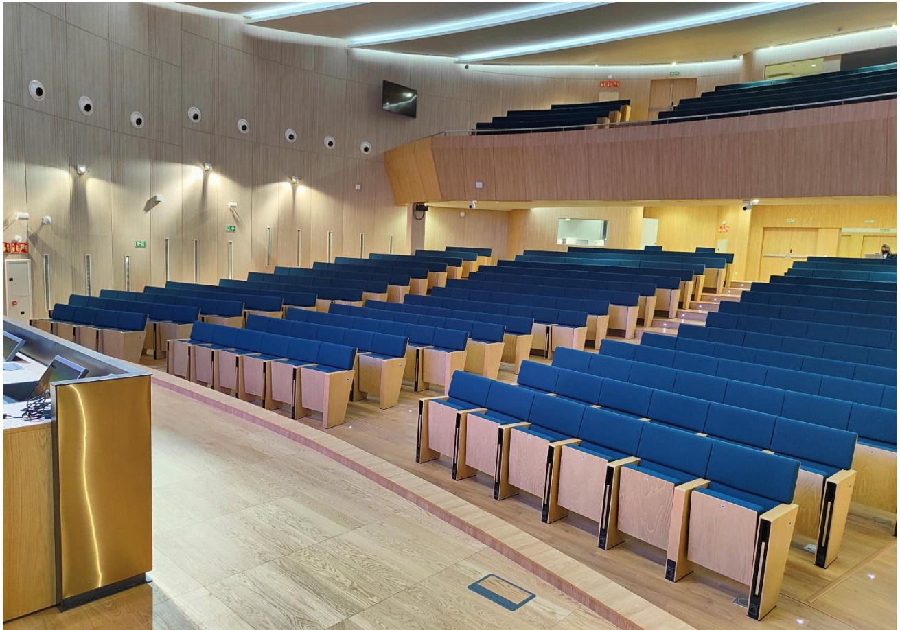
SALÓN DE ACTOS HOSPITAL UNIVERSITARIO 12 DE OCTUBRE MADRID | ESPAÑA