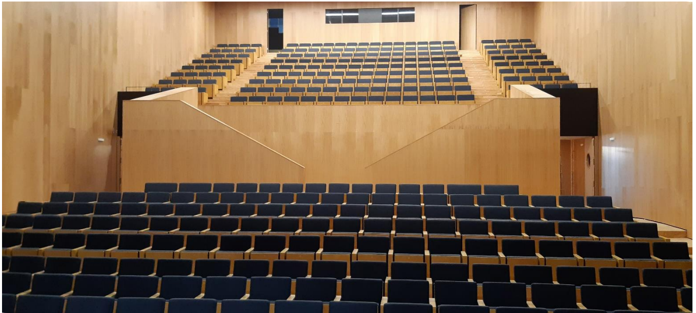
TEATRO AUDITORIO JOSÉ ANTONIO VALLS ALCANAR | CATALUÑA | ESPAÑA