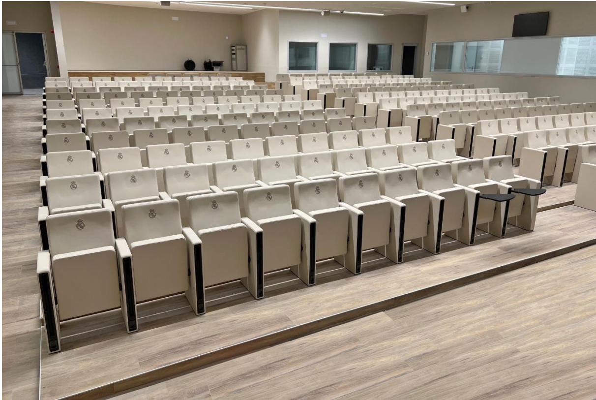
SALA DE PRENSA ESTADIO SANTIAGO BERBABÉU MADRID | ESPAÑA