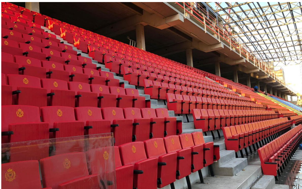
ESTADIO ACHTER DE KAZERNE MALINAS | BELGICA