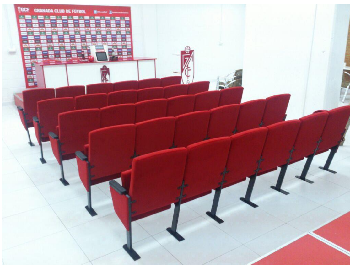
SALA DE PRENSA ESTADIO LOS CÁRMENES GRANADA | ANDALUCÍA | ESPAÑA