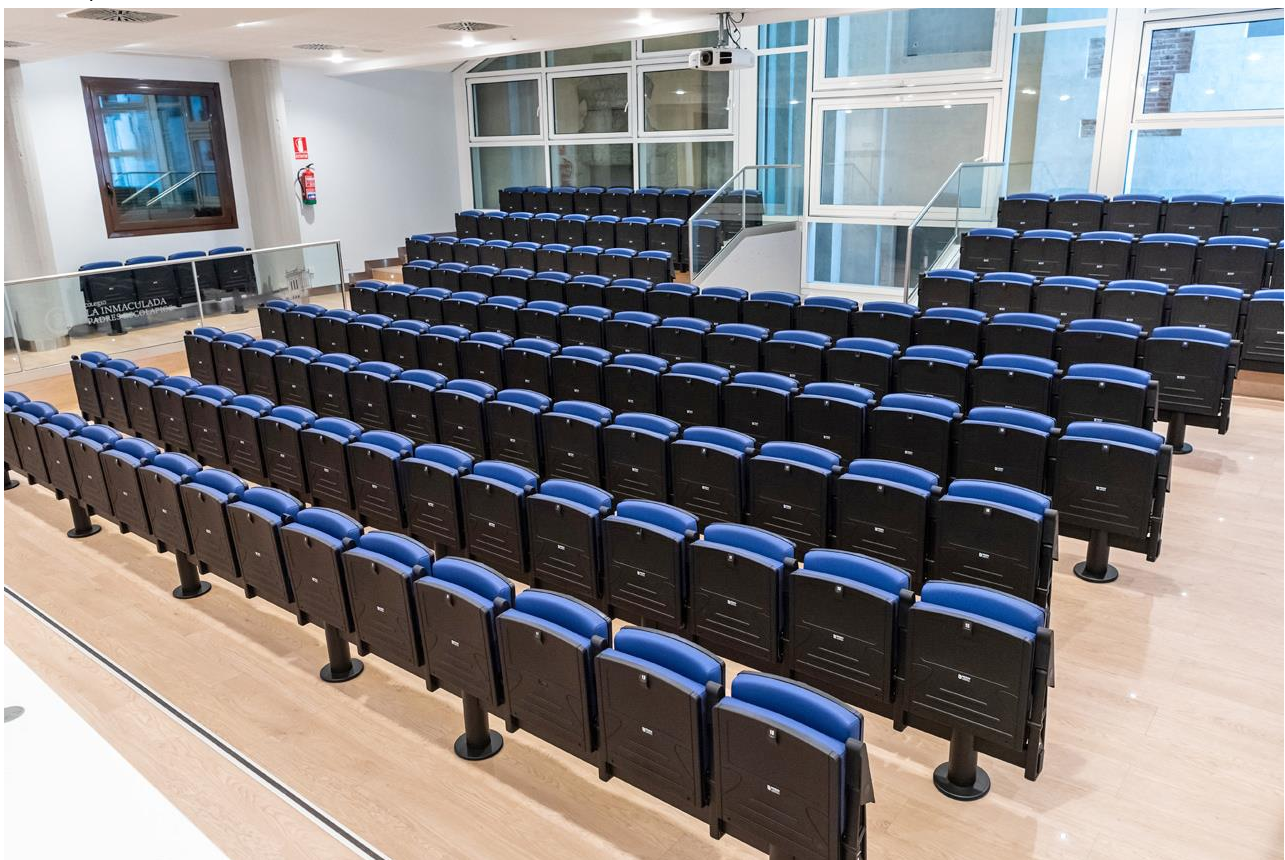
SALÓN DE ACTOS COLEGIO LA INMACULADA – PADRES ESCOLAPIOS GETAFE | MADRID | ESPAÑA