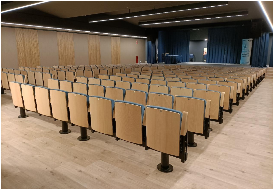
SALÓN DE ACTOS STELLA MARIS COLLEGE MADRID | ESPAÑA