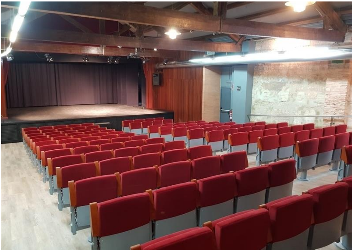
TEATRO DE LA PLAÇA SILLA | VALENCIA | ESPAÑA