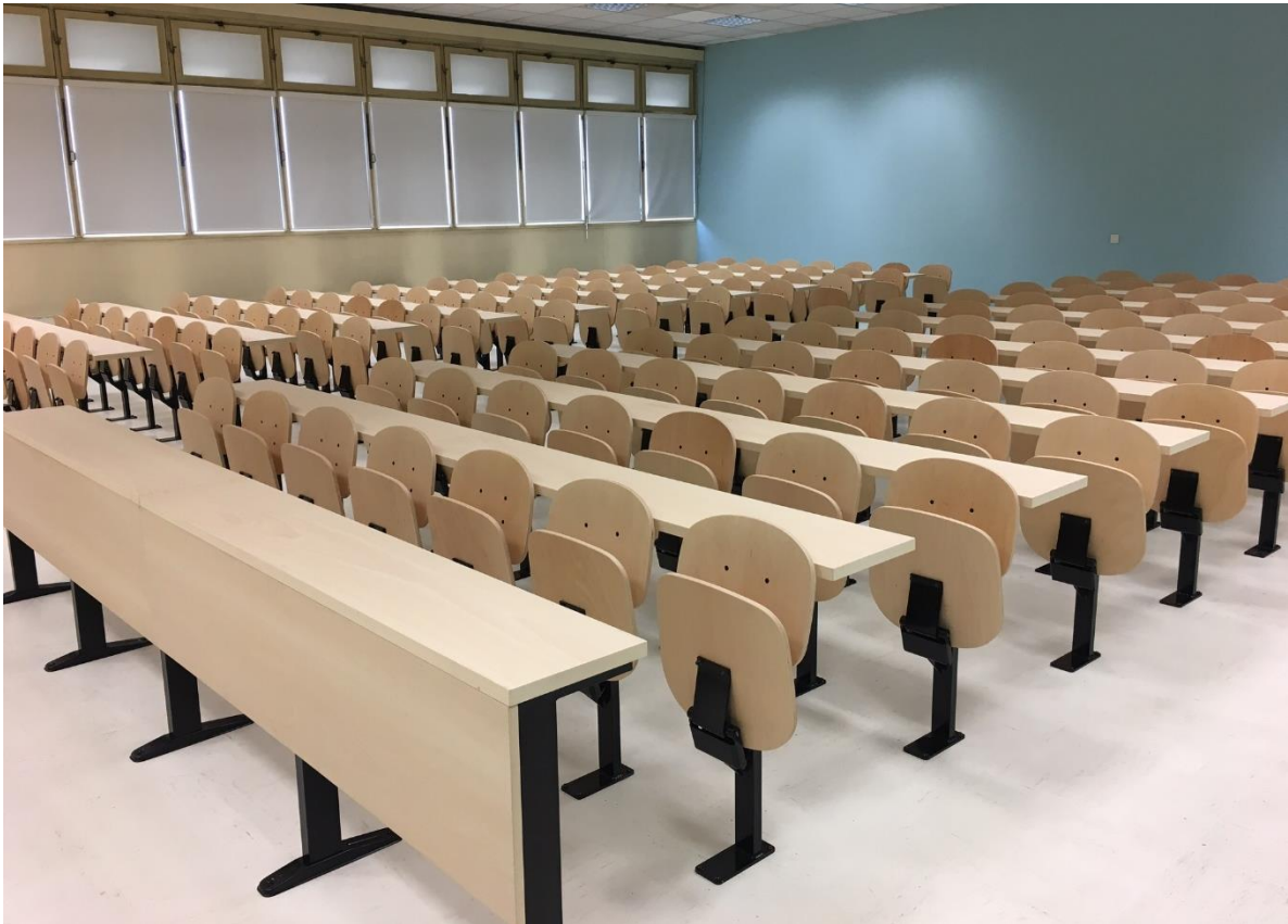
AULA IFSI BEAUVAIS | FRANCIA

Para Radio Menor de 10 metros las butacas se implantan con doble brazo (Individuales)