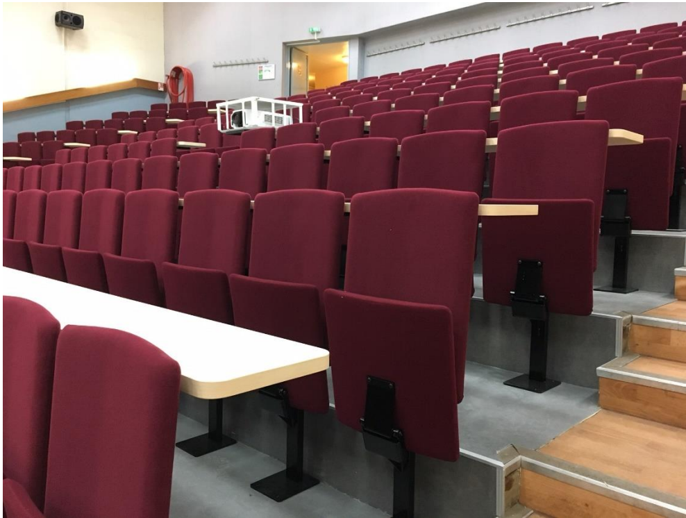
AULA ENSP YSSINGUEAUX | FRANCIA