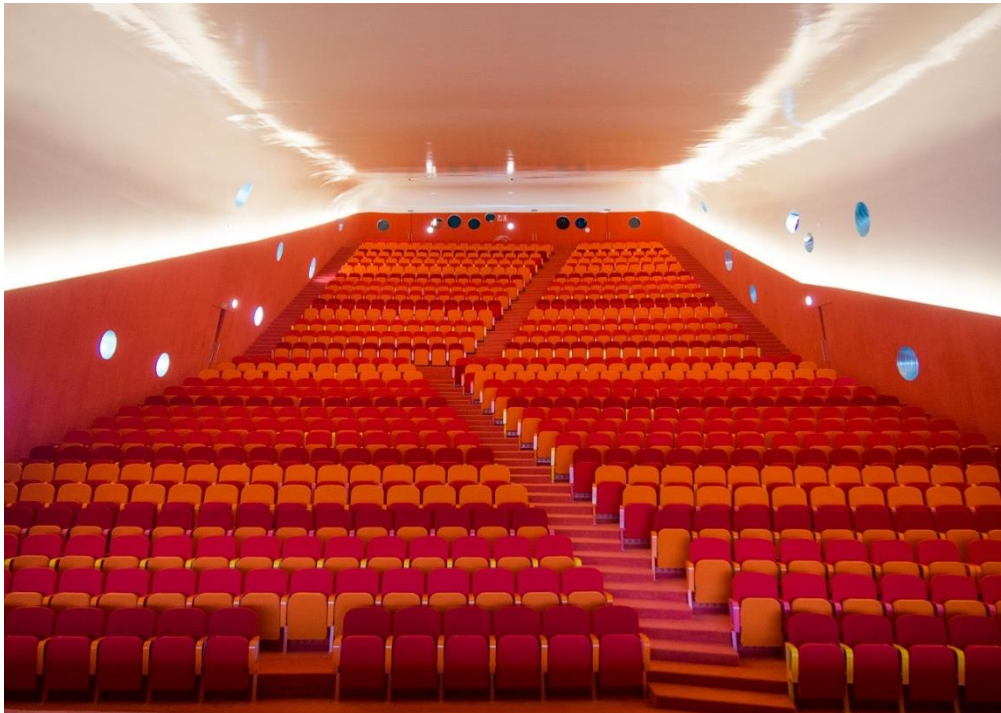
AUDITORIO PALACIO DE EXPOSICIONES Y CONGRESOS EN PLASENCIA PLASENCIA | CÁCERES | ESPAÑA