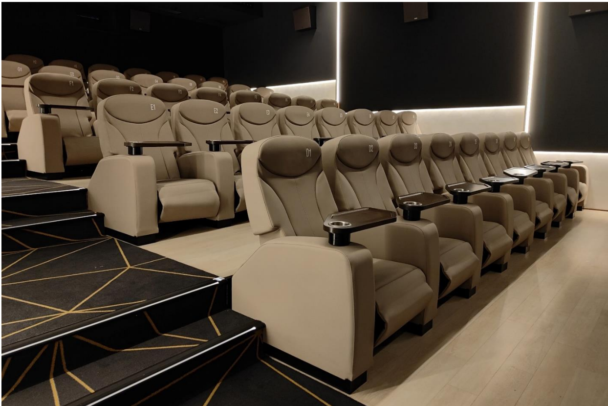
CINES OCINE PREMIUM PORTO PI PALMA | ILLES BALEARS | ESPAÑA