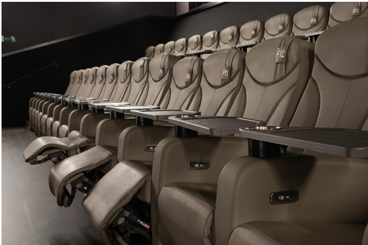
CINE YELMO PREMIUM BERCEO LOGROÑO | LA RIOJA | ESPAÑA