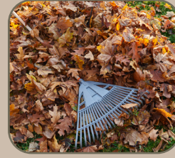
2. le ratisage avec le gratte-gratte des feuilles mortes