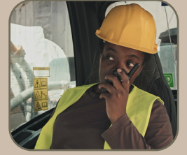
3. la communication radio