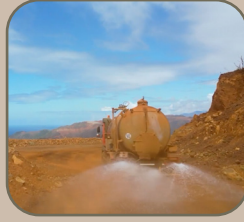
1. l'arrosage des pistes

Parmi ces actions, laquelle n'est PAS une mesure de sécurité réelle prise dans les mines modernes de NC ?