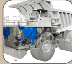
4. les cabines climatisées