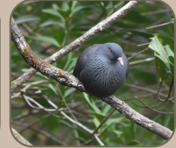
5. un lâcher de notous pour surveiller la biodiversité