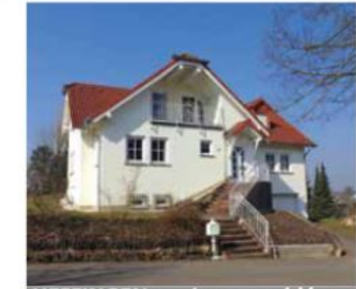
HEFFINGEN: maison meublée, 185m 2 , cuis éq, 4 ch, sdb, terr, jardin, double gge € 2.400.-