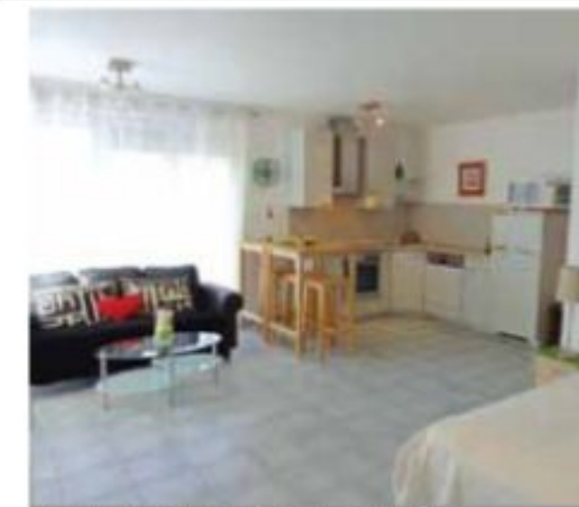
LUX-CENTS: beau studio meublé, 40 m 2 , cuis éq, sdd, buanderie, parking € 1.100.-