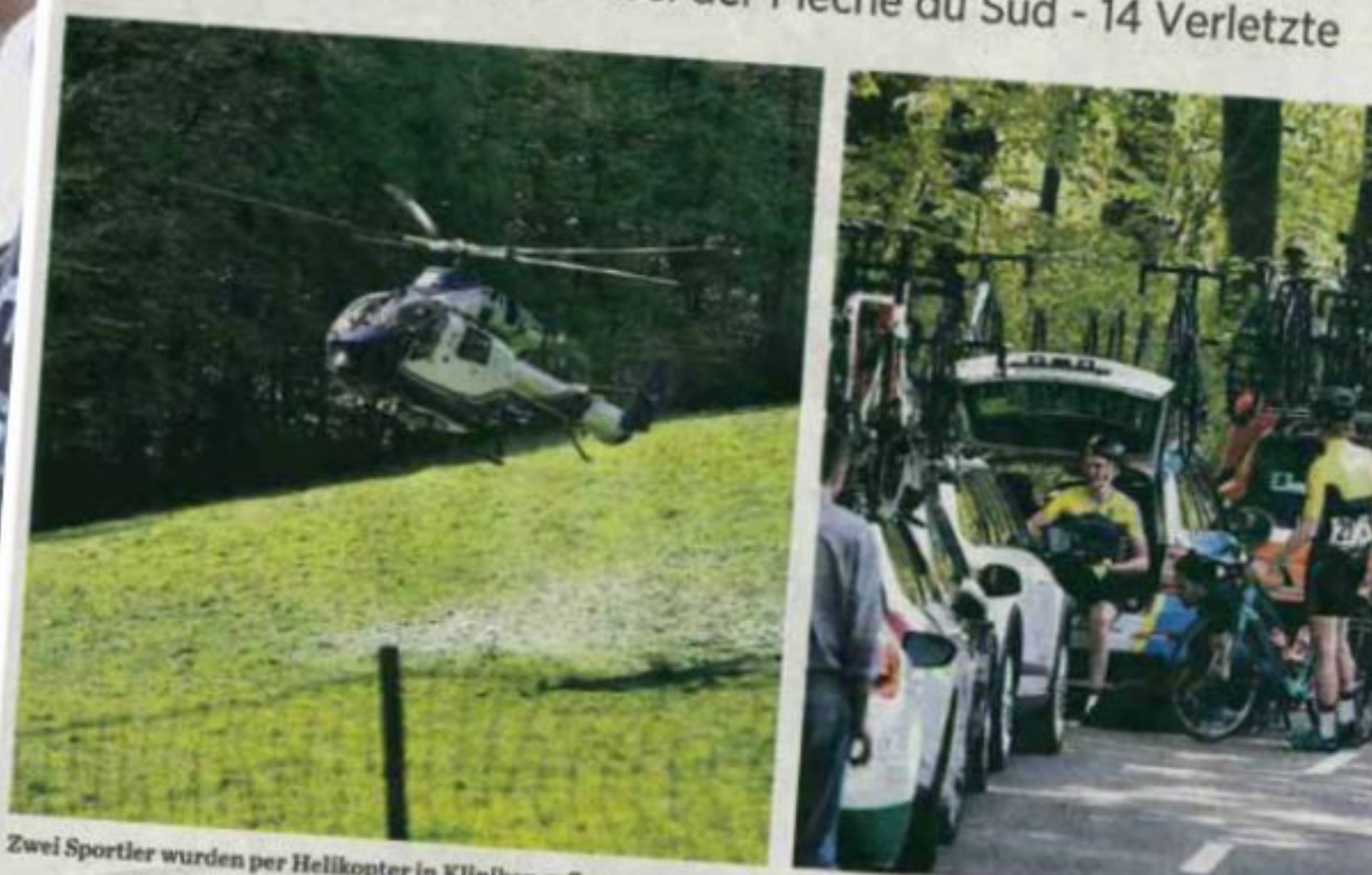
Zwei Sportler wurden per Helikopter in Kliniken geflogen Die Etappe wurde nach dem Unfall abgebrochen

Massensturz bei der Flèche du Sud - 14 Verletzte