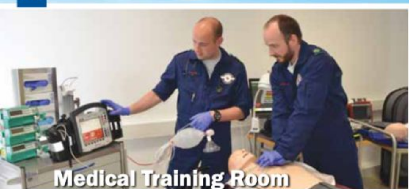
Medical Training Room

Folgende Einblicke in die neuen LAR Räumlichkeiten illustrieren, inwiefern das neue Zuhause eine Verbesserung darstellt: