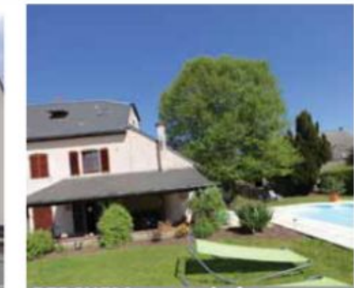
BERCHEM: corps de ferme sur 20a05ca, 5 ch, cour, gges, grd jardin, atelier € 1.670.000.-