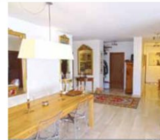
LUX-BELAIR: appartement, 142 m 2 , balcon vue dégagée, cuis éq, 2 ch, 2 sdb, gge € 895.000.-