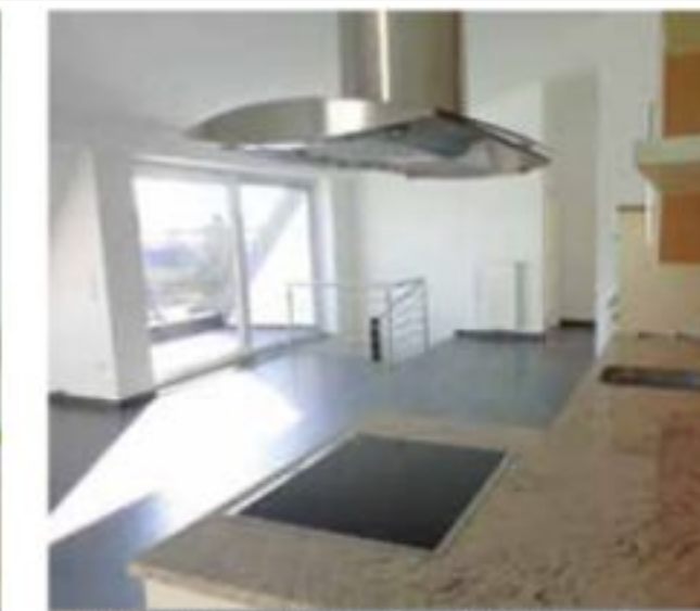
JUNGLINSTER: duplex neuf, 100m 2 , 2 ch, cuis éq, sdb, sdd, 2 balcons, parking € 1.700.-