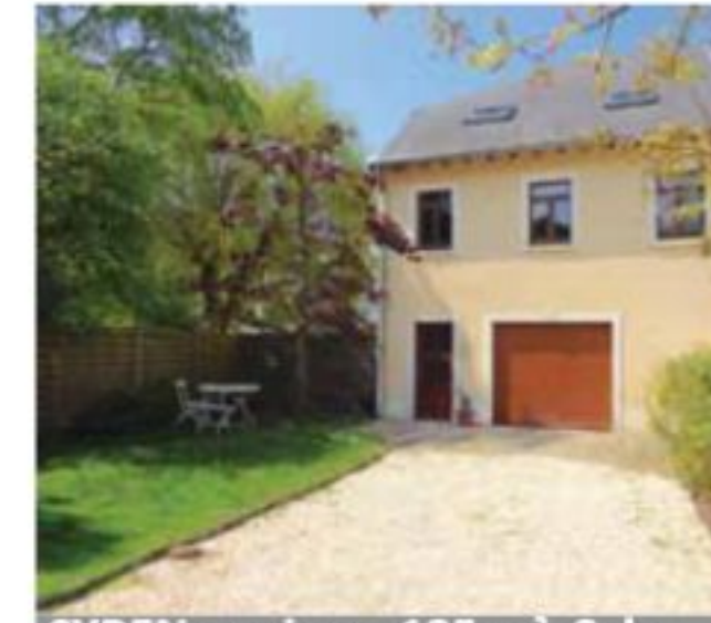
SYREN: maison, 135 m 2 , 3ch, sdb, sdd, buanderie, cour, jardin, gge fermé € 1.800.-