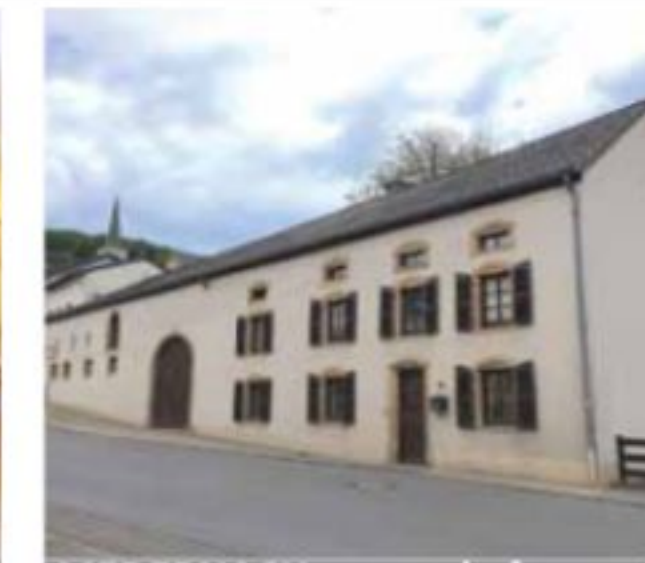
MEDERNACH: corps de ferme, 3 ch, grange, atelier, écuries, cour, dépendances € 725.000.-