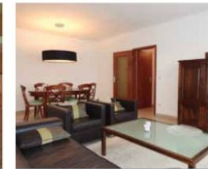
LUX-BONNEVOIE: penthouse meublé, 55m 2 , 5 ème , 1 ch, sdd, cuis éq, grd balcon € 1.400.-