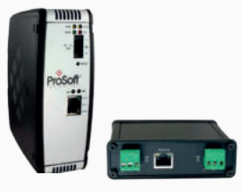
Gateways de Comunicação

Integre redes Modbus TCP/IP, EtherNet/IP, DH+, RIO e PROFINET com conversão de protocolo, transferência de dados bidirecional e desempenho de alta velocidade.