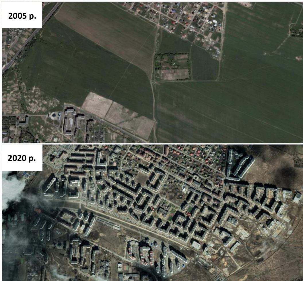
Рисунок 3.2: Забудова Софіївської Борщагівки 2005-2020