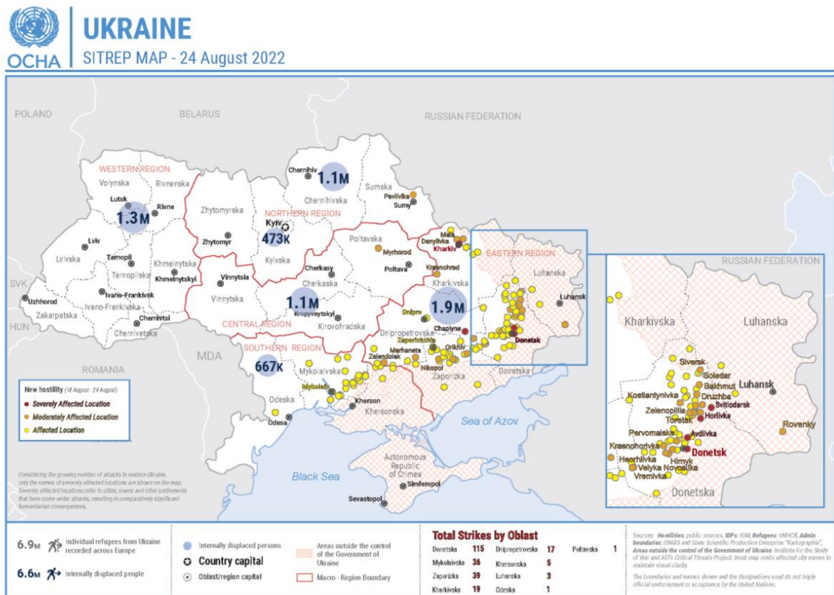
Рисунок 5.1: Ситуаційний звіт МОМ ООН 24 серпня 2022 р

Для осучаснення презентації Лідії, ми включили останню версію, використаної нею карти Ситуаційного Звіту від ООН. Попри зміну росією своїх цілей у війні, ВПО продовжують розподілятися по Україні. Загальна кількість ВПО скоротилася на 500 тис. до 6,6 млн, тоді як кількість біженців до Європи зростає на 1,9 млн.