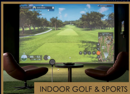
INDOOR GOLF & SPORTS