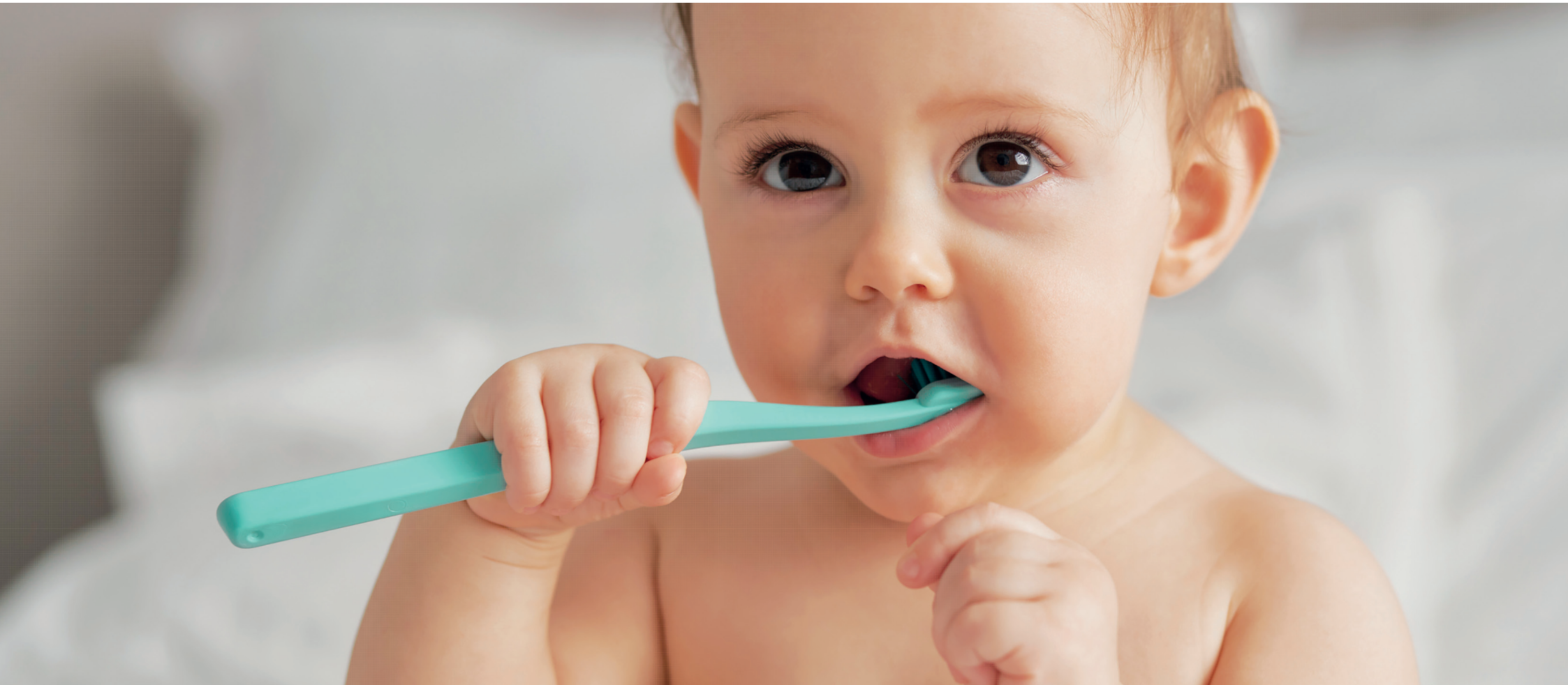
Sechs zahnärztliche Früherkennungsuntersuchungen für Kinder