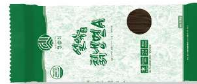
취 냉면 A 200g

국내산 취, 볶음메밀이 들어가 더욱 고소한 풍미 중량 200g 박스입수 1봉 | 10인분 x 8입