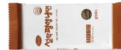
설악 평양 냉면 골드 200g

냉면의 정석, 깊고 깔끔한 맛 중량 220g 박스입수 1봉 | 10인분 x 8입