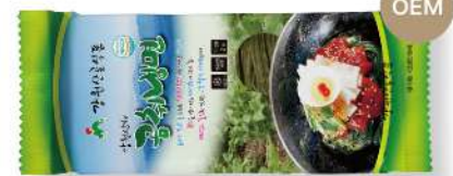
곰취 냉면 200g

메밀의 고소한 풍미와 부드러운 식감을 살린 면발 중량 200g 박스입수 1봉 | 10인분 x 8입