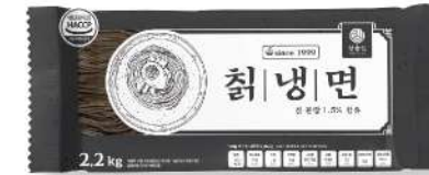
취 냉면 f-203 220g

국내산 취, 볶음메밀이 들어가 더욱 고소한 풍미 중량 200g 박스입수 1봉 | 10인분 x 8입