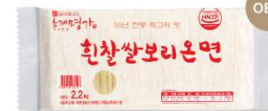
흰찰쌀보리 온면 (중화명) 220g

풀깃한 식감을 오래 유지시키는 것이 특징입니다 중량 220g 박스입수 1봉 | 10인분 x 8입