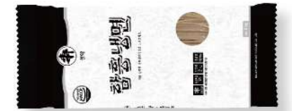
함흥 냉면 200g

국내산 취, 볶음메밀이 들어가 더욱 고소한 풍미 중량 220g 박스입수 1봉 | 10인분 x 8입