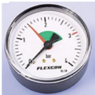
Afb. 3. Manometer

In deze stadsverwarmingsinstallaties wordt centraal de druk geregeld. Deze worden indien nodig ook centraal bijgevoerd. In de woning hoeft dus enkel ontlucht te worden( instructie zie pagina 7). Bijvullen in de woning is bij dit type stadsverwarming installatie niet nodig.