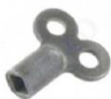
Afb. 7. Ontluchtings sleutel

Let op! Draai nooit de spindel helemaal uit het ventiel!