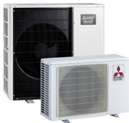
Afb. 2. Buitendeel combi warmtepomp voor verwarming en warm tapwater