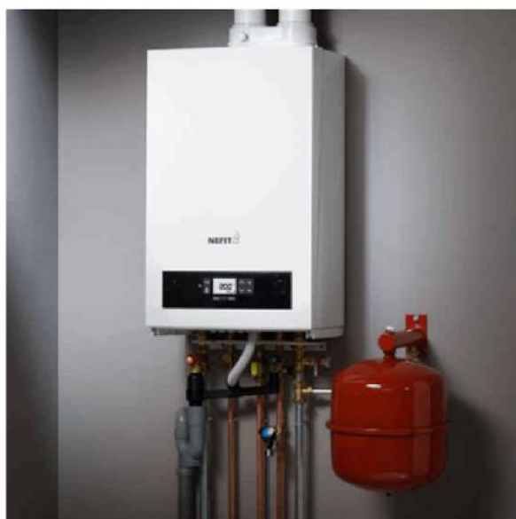
Afb. 1. CV-ketel