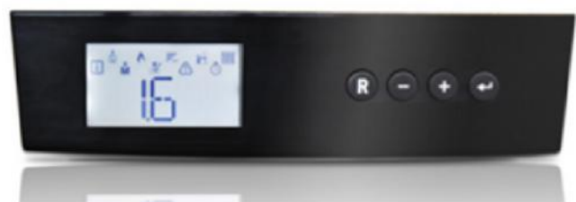
Afb. 4. Display cv-ketel met weergave installatiedruk