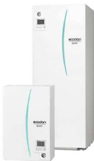
Afb. 2. Binnendeel lucht-water warmtepomp