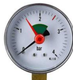
Afb. 6. Manometer