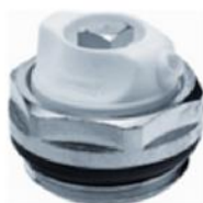
Afb. 8. Ontluchtingsventiel