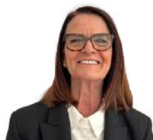
Assomption Linzoain Retraitée