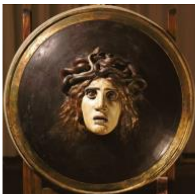
Schild mit Gorgonen- (Medusen-)haupt.