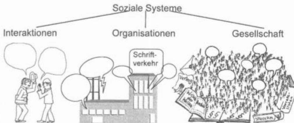
Abb. 5.2 Interaktionen, Organisationen, Gesellschaft: alles soziale Systeme – bestehend aus Kommunikation (nicht aus Menschen, Gebäuden, Territorien)

Alle Gesellschaften, Organisationen und Interaktionen sind soziale Systeme , weil sie aus Kommunikationen bestehen.