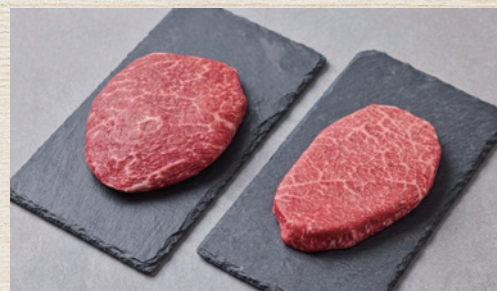
近江牛・和牛ステーキ食べ比べ (各200g)