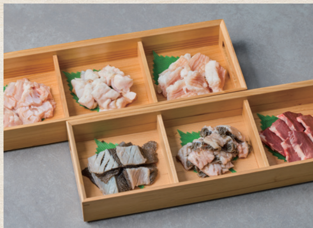
近江牛ホルモン食べ比べ (厳選6種・3種)