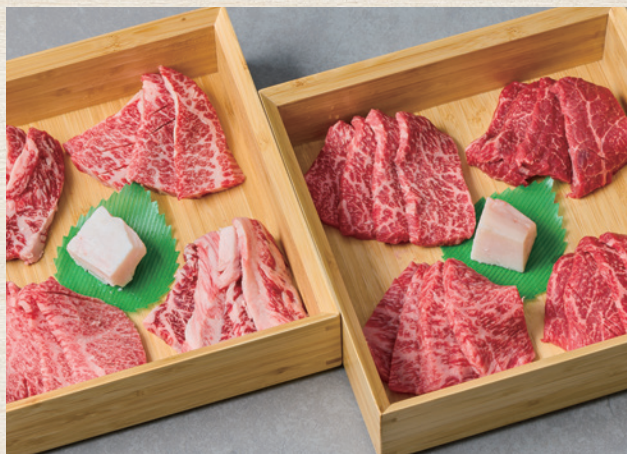
近江牛希少部位食べ比べ (厳選8種・5種・3種)

お料理に関してはご宿泊当日・お食事時の追加はできません。 オプションでの事前追加注文のみとなりますので予めご了承ください。