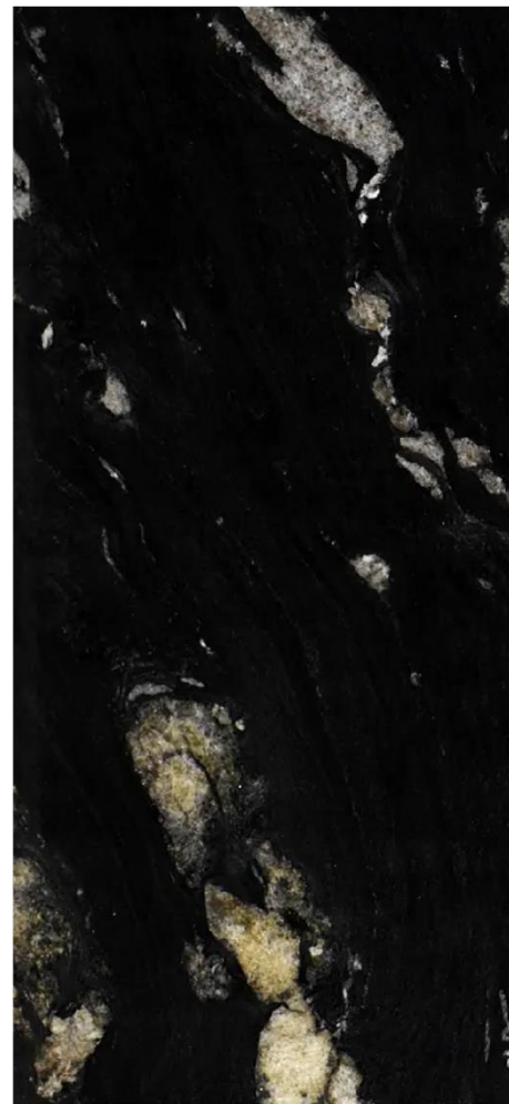
ETNA BLACK XISTO