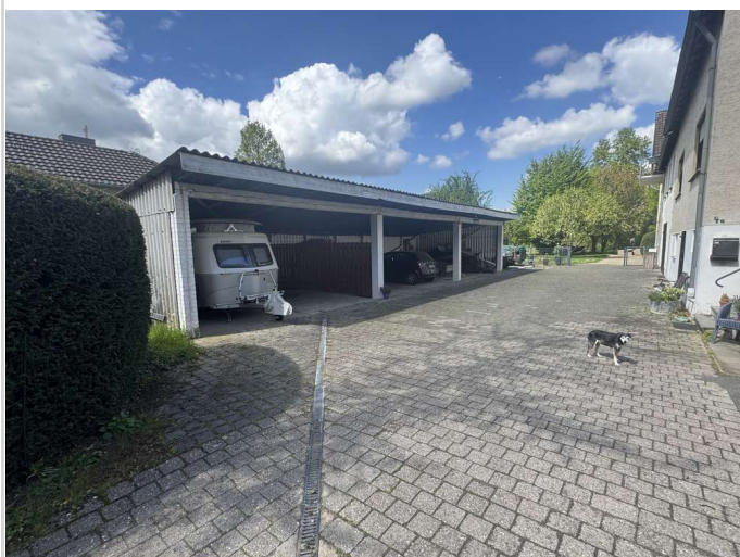
Carpots für 6 Fahrzeuge