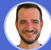
CLÉMENT Expert I.A.